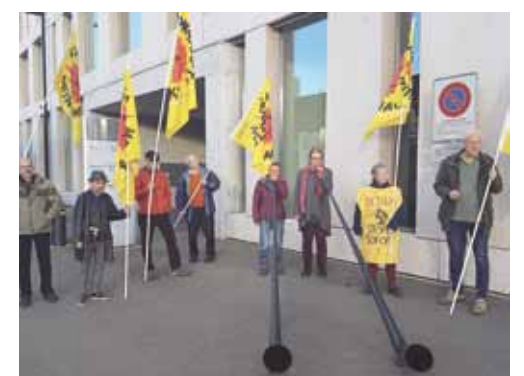
Unermüdlich: Die Leute von der ENSI-Mahnwache, hier am 9. Jahrestag des Fukushima-Gaus 2020.