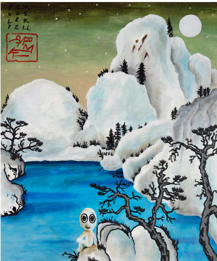
Abbildung 3: M.S. Bastian / Isabelle L., Pulp am See, 2018 + 2020 + 2021, Mischtechnik auf Leinwand, 60 x 50 cm