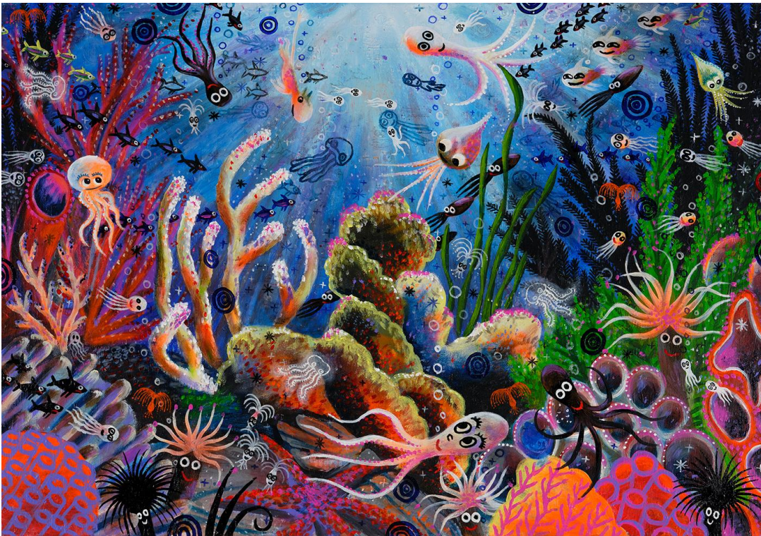
Abbildung 2: M.S. Bastian / Isabelle L., Der kleine Wasserpulp, 2017 + 2020 + 2021, Mischtechnik auf Leinwand, 70 x 100 cm