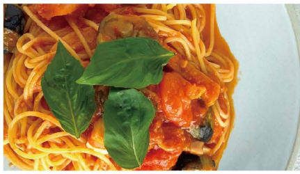
7 なすとモッツアレラ なす、ベーコン、モッツアレラチーズ 単品 1,045 (1,150)