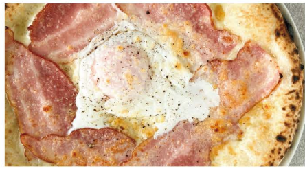
13 ビスマルク モッツアレラ、ベーコン、卵 単品 1,045 (1,150)