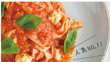
1 完熟トマトとモッツアレラ 生パスタ トマト、バジル、グラナパダーノ、モッツアレラ 単品 1,045 (1,150)