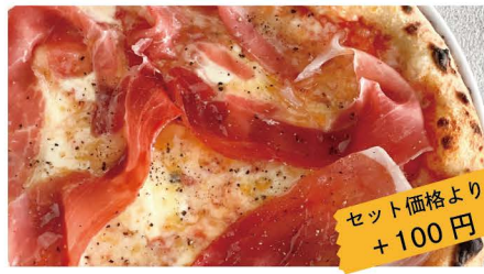
16 プロシュートマスカルポーネ グリーンペッパー、イタリア産生ハム、モッツアレラ、マスカルポーネ セット価格より +100円 単品 1,272 (1,400)