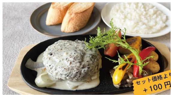
23 100%BEEF ハンバーグ ゴルゴンゾーラ イタリアのゴルゴンゾーラと生クリームから作るアロマオリジナルソース 単品 1,000 (1,100) ライス or パン付 1,181 (1,300)