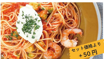
10 海老とアボカドのマスカルポーネ DE トマトクリーム 海老、アボカド、マスカルポーネ セット価格より +50円 単品 1,090 (1,200)