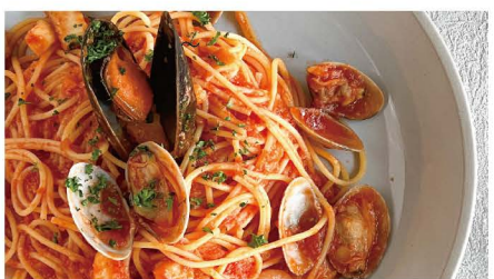
9 マーレトマト (魚介のトマトソース) えび、イカ、活あさり、ムール貝 単品 1,045 (1,150)