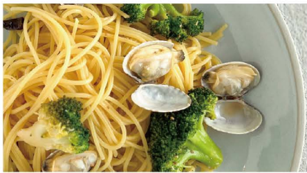
5 あさりとブロッコリーのペペロンチーノ あさり、ブロッコリー 単品 1,000 (1,100)