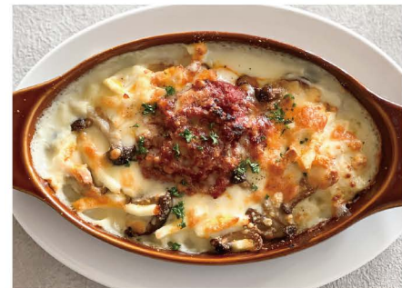
18 きのこの玄米和風ミートドリア きのこ、ミートソース、チーズ、ベジタブルソース 単品 1,000 (1,100)