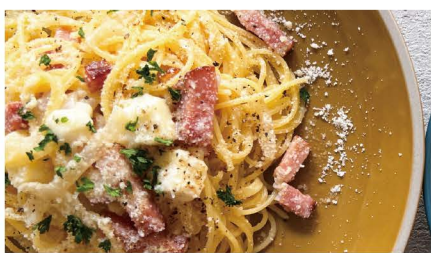
3 ベーコンとモッツアレラチーズ ベーコン、玉ねぎ、モッツアレラ、グラナパダーノ 単品 1,000 (1,100)