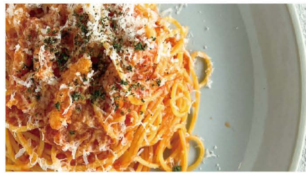
6 ベーコンとチーズのアマトリチャーナ ベーコン、オニオン、チーズ 単品 1,000 (1,100)