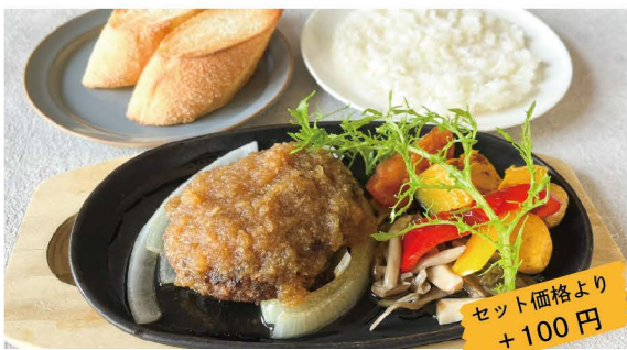
21 100%BEEF ハンバーグ 和風ソース 玉葱を使った自家製の和風ソースはほんのリビネガーが効いた醤油ベース 単品 1,000 (1,100) ライス or パン付 1,181 (1,300)