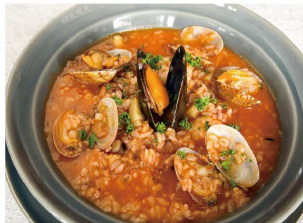
19 地中海風 魚介の雑穀米トマトリゾット あさり、ホタテ、ムール貝、イカ、海老 単品 1,045 (1,150)