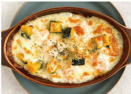
17 海老とカボチャの玄米ドリア 海老、カボチャ、チーズ、ベジタブルソース 単品 1,000 (1,100)