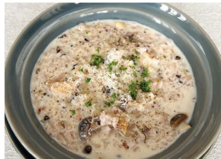
20 きのこのパルミジャーノ雑穀米リゾット きのこ、クリーム、チーズ 単品 1,045 (1,150)