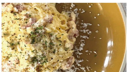
2 カルボナーラ フェットチーネ生パスタ パンチェッタ、卵、生クリーム、チーズ 単品 1,000 (1,100)