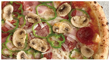
14 ミックスピザ モッツアレラ、ベーコン、サラミ、オニオン、ピーマン、マッシュルーム 単品 1,045 (1,150)