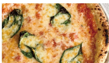
11 マルゲリータ トマト、バジル、モッツアレラ 単品 1,045 (1,150)