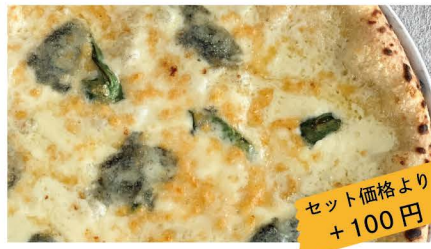
15 クワトロフォルマッジョ モッツアレラ、ゴルゴンゾーラ、グラナパダーノ、マスカルポーネ セット価格より +100円 単品 1,272 (1,400)