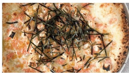
12 明太子ともち もち、明太子、海苔 単品 909 (1,000)