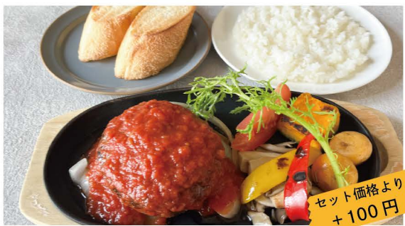
22 100%BEEF ハンバーグ トマトソース アロマの pasta でも使用している自家製のトマトソースを使用 単品 1,000 (1,100) ライス or パン付 1,181 (1,300)