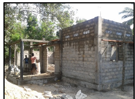
3. Muren van de school gereed