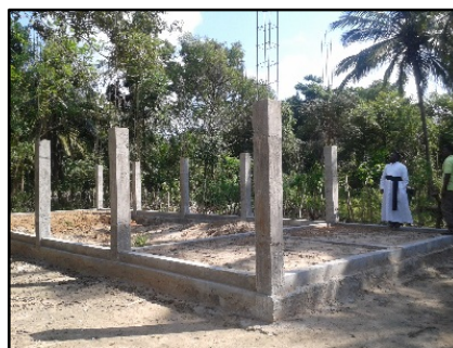
2. Bouwfase 1 gereed: fundatie