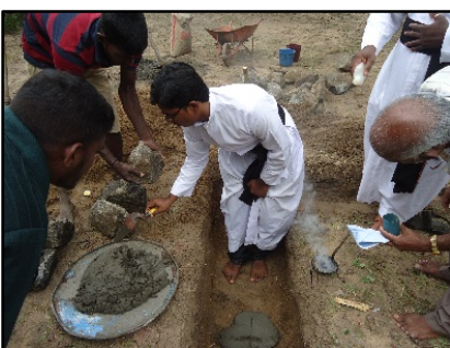
1. Eerste steen legging