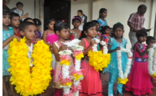
Ontvangst met bloemen

In november 2015 hebben we een projectbezoek gebracht aan de pre-school St. Anthony's. Deze dag werd de pre-school ook officieel geopend door ons. Vanaf mei 2015 is de pre-school al in gebruik. We werden onthaald door vrolijke ouders en kinderen welke klaar stonden om ons te begroeten met kleurrijke bloemenslingers.