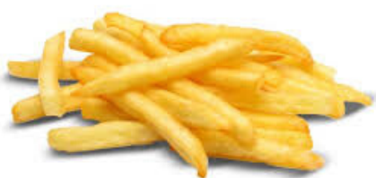
patatine fritte 150gr.