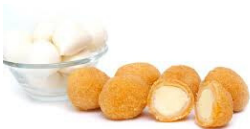
mozzarelline fritte 10pz