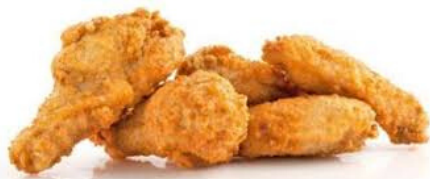
ali di pollo 6pz