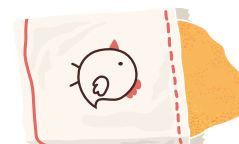
COTOLETTA DI POLLO (100 GRAMMI)