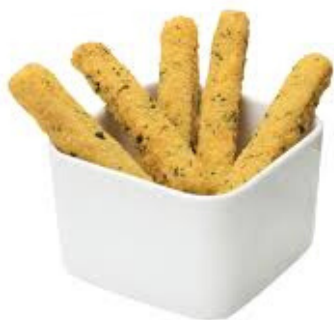
bastoncini di pollo 10pz