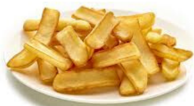
patatine dippers 150 gr.