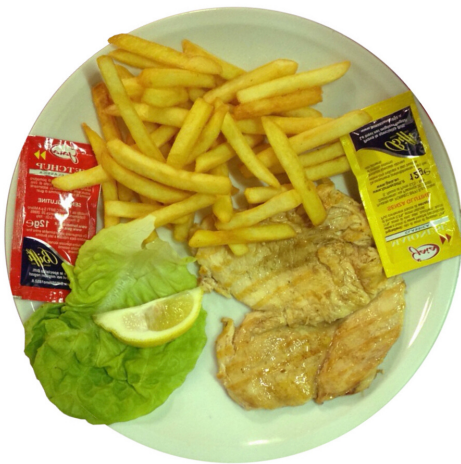
PETTO DI POLLO ALLA GRIGLIA CON PATATINE FRITTE