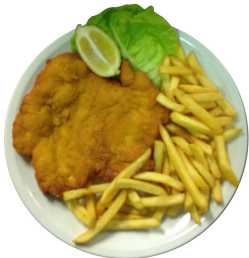
COTOLETTA DI POLLO DOPPIA PANATURA CON PATATINE FRITTE