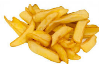
steak house 150 gr.