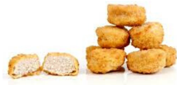
pepite di pollo 10pz