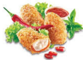
jalapenos red hot 5pz