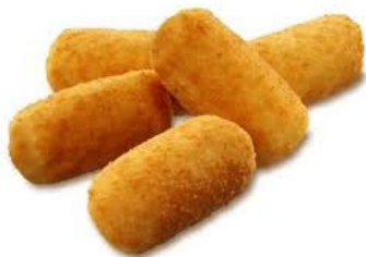
crocchette di patate 10pz