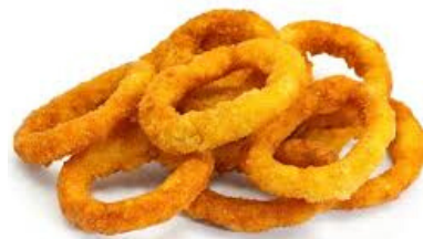
anelli di cipolla 10pz