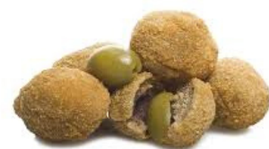
olive ascolana 10pz