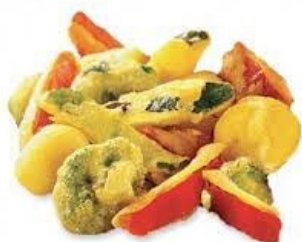
verdure miste pastellate fritte 150 gr.