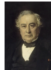
Isaac Pereire (1806-1880)

Fils d'un couple de bourgeois juifs bordelais, il monte à Paris en 1833 et devient couturier d'affaires. Dès 1835, il obtient avec son frère Isaac la concession de plusieurs lignes de chemin de fer. Il fonde aussi le Crédit mobilier en 1857 qui finance en partie les travaux du baron Haussmann à Paris et il élu député en 1863. En 1869, il ne se représente pas.