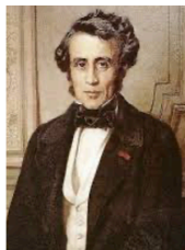
Émile Pereire (1800-1875)

Haut fonctionnaire, il est renvoyé sous la Deuxième République avant d'être réintégré sous le Second Empire. Il est nommé préfet de la Seine en 1853 et est chargé de mener des travaux pour réaménager la capitale. Il est fait baron en 1857. Il est renvoyé par Émile Ollivier en 1870 et fait l'objet de nombreuses critiques les républicains.