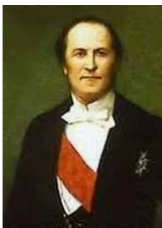
Georges Haussmann (1809-1891)

Haut fonctionnaire, il est renvoyé sous la Deuxième République avant d'être réintégré sous le Second Empire. Il est nommé préfet de la Seine en 1853 et est chargé de mener des travaux pour réaménager la capitale. Il est fait baron en 1857. Il est renvoyé par Émile Ollivier en 1870 et fait l'objet de nombreuses critiques les républicains.