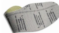
Plantilla anti perforacion flexible