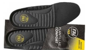
Plantillas extraíbles. Lavable