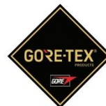
Membrana del forro impermeable + transpirable