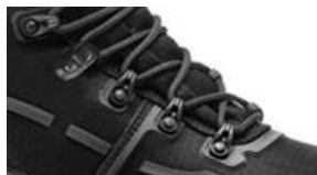
Ganchos reforzados no metálicos