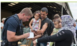
Fluchtursachen und Asylverfahren

Fluchtursachen und Asylverfahren, Didact-media – 20 Min. Der Film benennt Fluchtgründe und zeigt drei Beispiele anerkannter Asyl-suchender, EDMOND 5563541, DVD 4675286