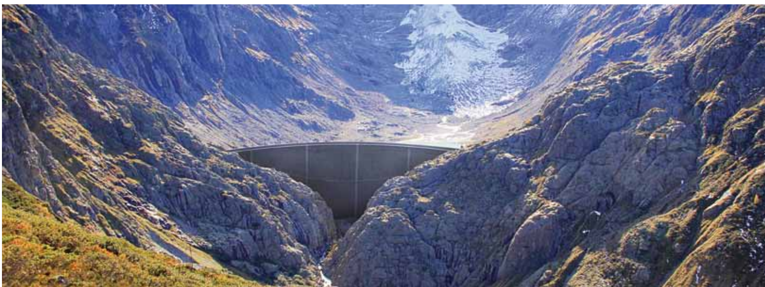
Fotomontage der Staumauer des Triftsees. Der Gletscher im Hintergrund ist bereits heute weggeschmolzen.