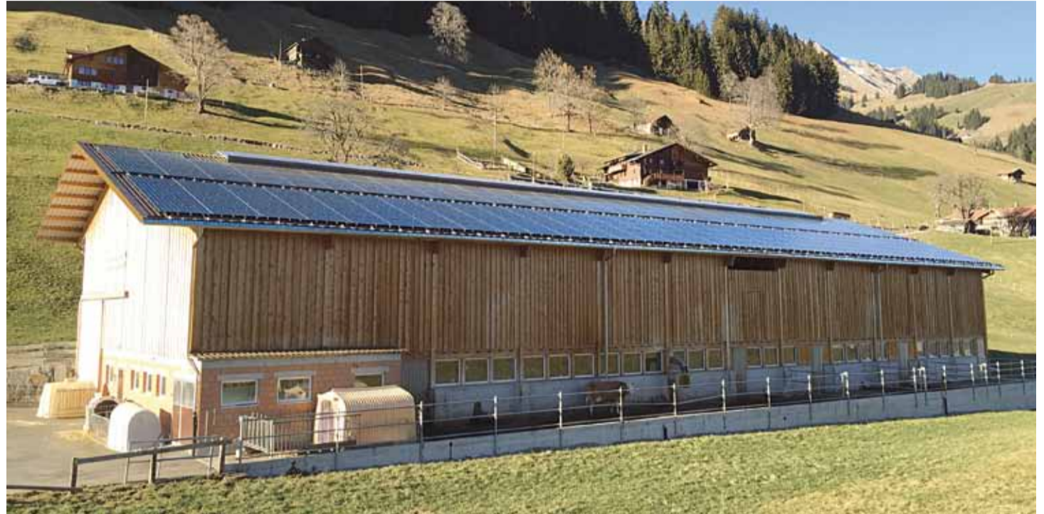
Wenn der Betreiber dieser Solaranlage zu jedem Nachbarn eine eigene Stromleitung bauen muss, kosten die Leitungen mehr als die Solaranlage Ried bei Frutigen | Foto + Solaranlage: Peter Stutz