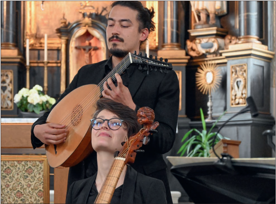
Aufnahme anlässlich eines Konzertes in der Heilig-Blut-Kirche im Mai 2023. Das international zusammengesetzte, fünfköpfige Ensemble Concerto di Margherita pflegt die historische Praxis des selbstbegleiteten Singens auf höchstem Niveau.