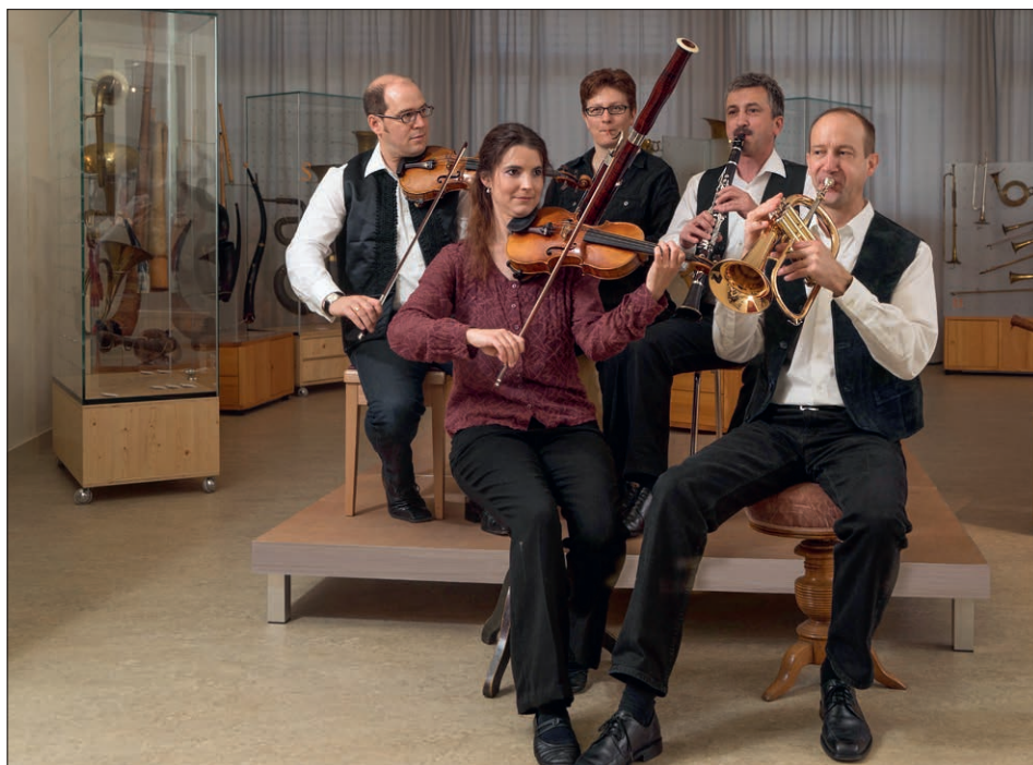
Die Husitein-Musik posiert in der ehemaligen Musikinstrumentensammlung Willisau für eine Foto.