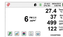
環境センサーデータ