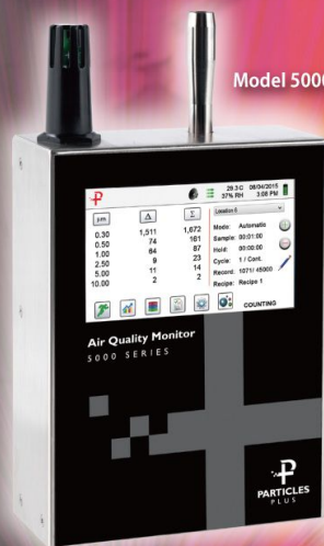
Model 5000AQM 超高濃度シリーズ