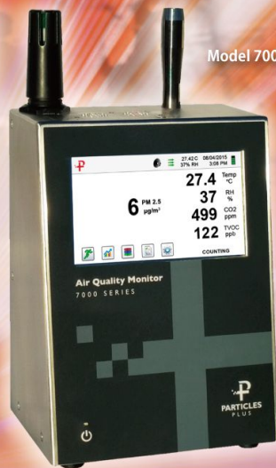
Model 7000AQM 超高濃度シリーズ