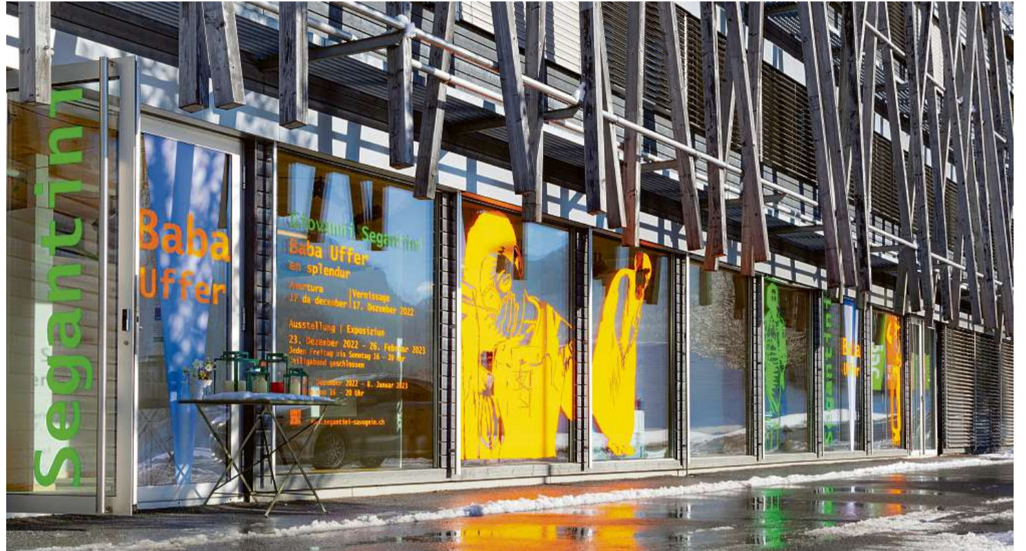
Las calours veivas duessan render attent.