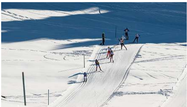
A Lai ins spetga anc sen tals cundiziuns da neiv scu durant igl Planoiras 2022.