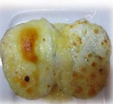
Twice baked potatoes G