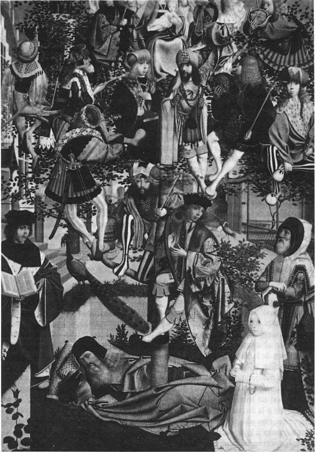
ANÓNIMO: El Árbol de Jessé . Rijkmuseum. Amsterdam.