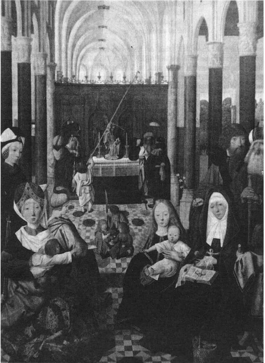
G. TOT SINT JAMS: La Familia de Cristo . Rijkmuseum. Amsterdam.