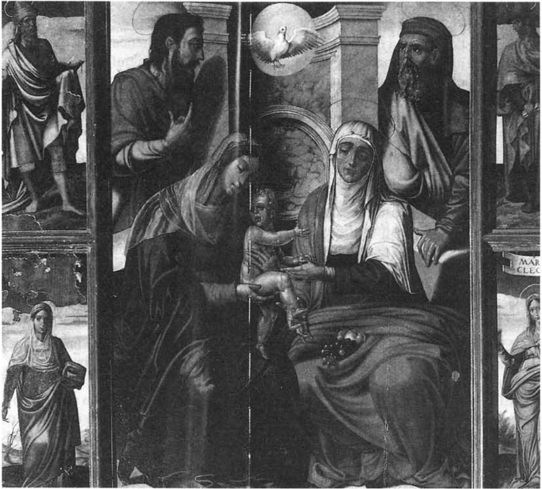
H. DE ESTURMIO: La Parentela de Jesús . Iglesia de la Virgen de la O. Sanlúcar de Barrameda.