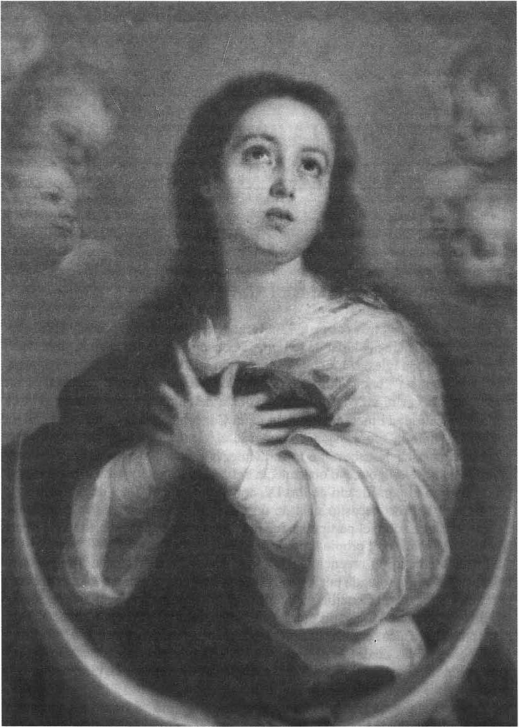
B. E. MURILLO: Inmaculada . Museo del Prado. Madrid.