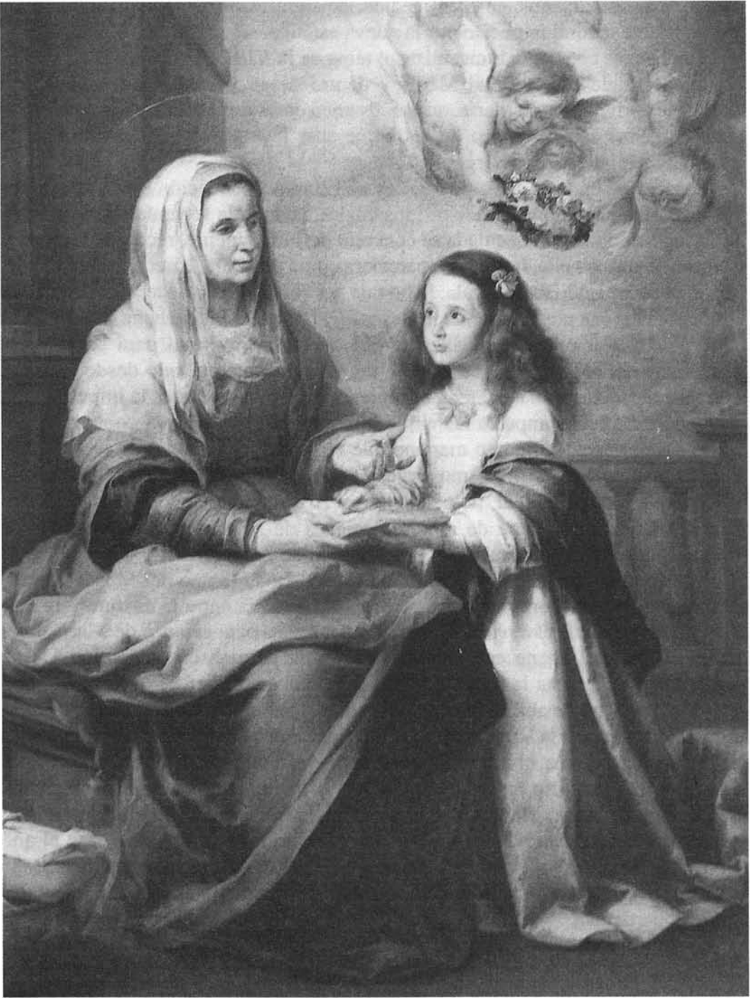
B. E. MURILLO: El Magisterio de Santa Ana . Museo del Prado. Madrid.