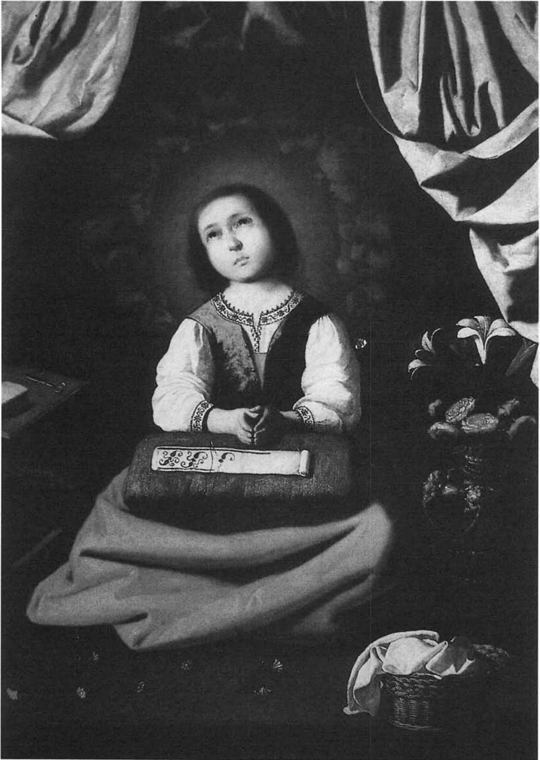
F. ZURBARÁN: Virgen Niña . Museo Metropolitano. Nueva York.