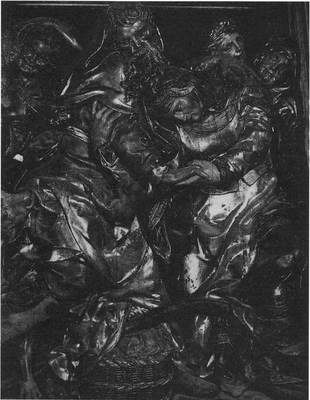
J. DE JUNI: El Abrazo en la Puerta Dorada . Iglesia de Santa María. Medina de Rioseco.