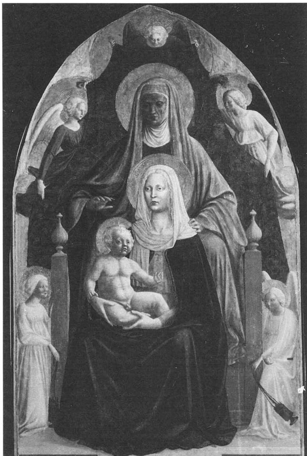
MASACCIO: Santa Ana Triple . Galería de los Uffizi. Florencia.