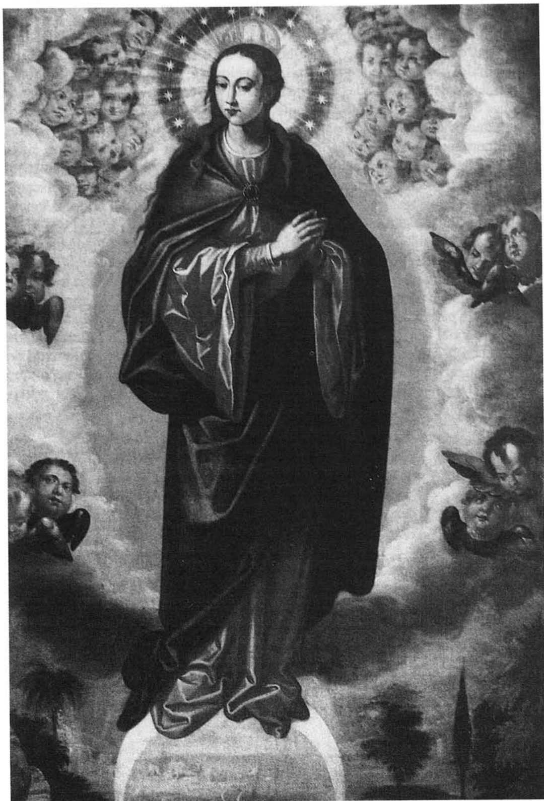
F. PACHECO: Inmaculada . Catedral. Sevilla.