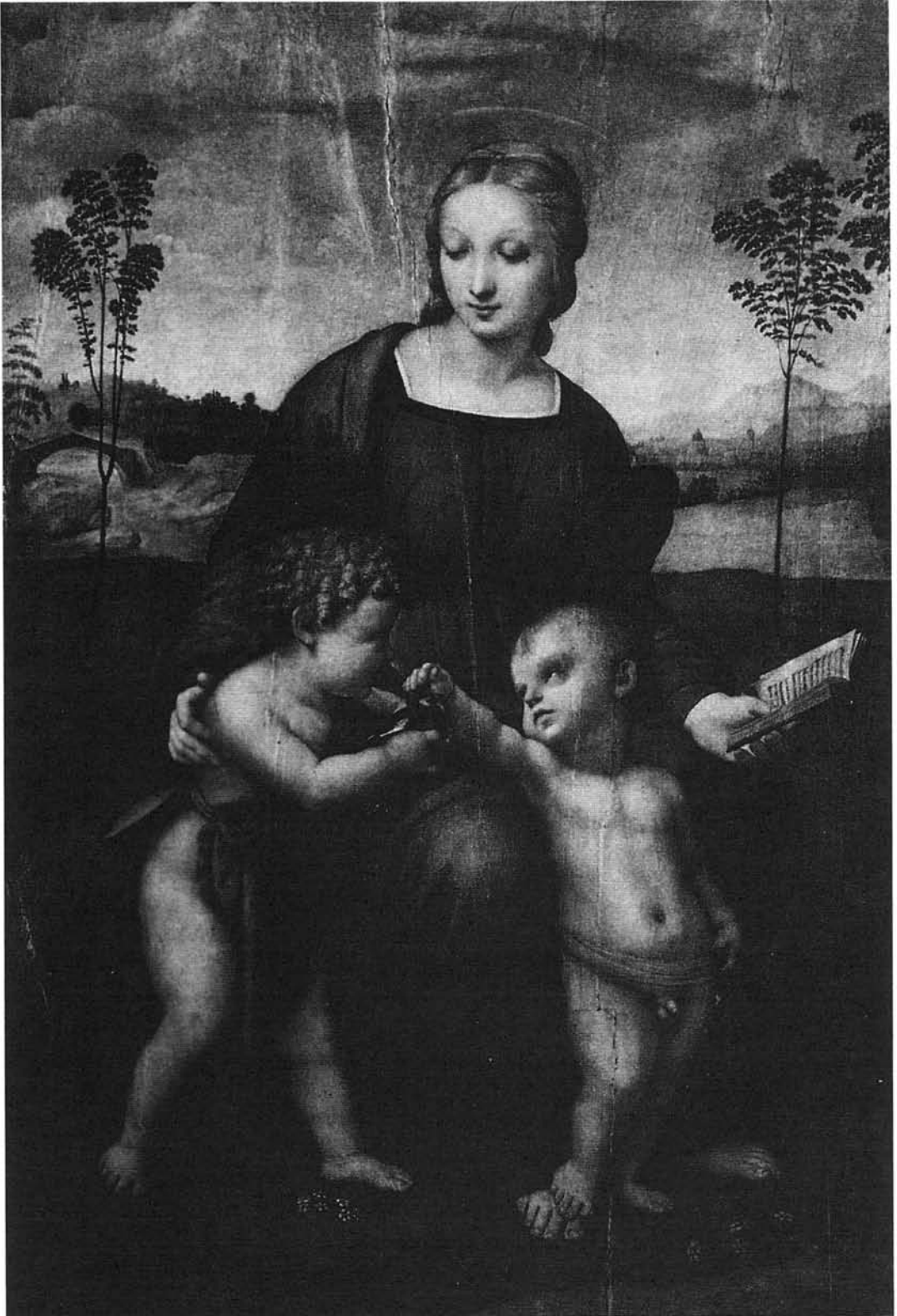
RAFAEL: La Virgen del Jilguero . Galería de los Uffizi. Florencia.