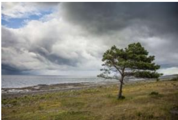
Einsames Öland.