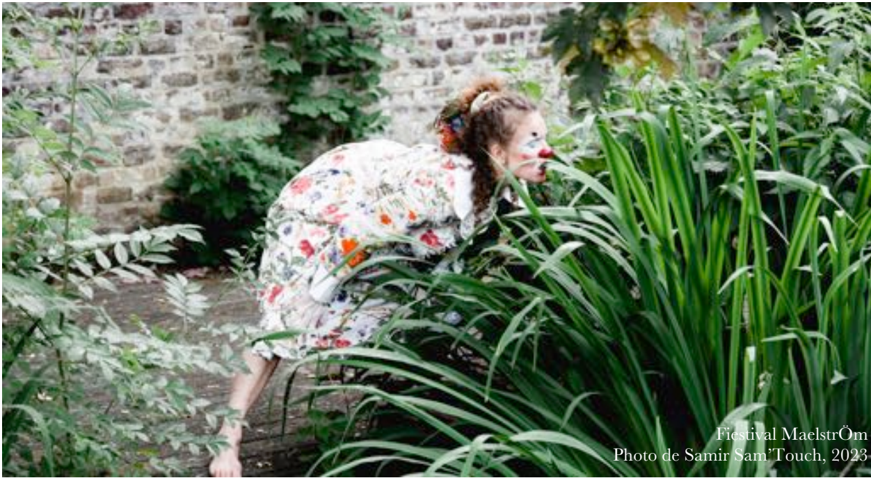
Festival Maelström, 2023