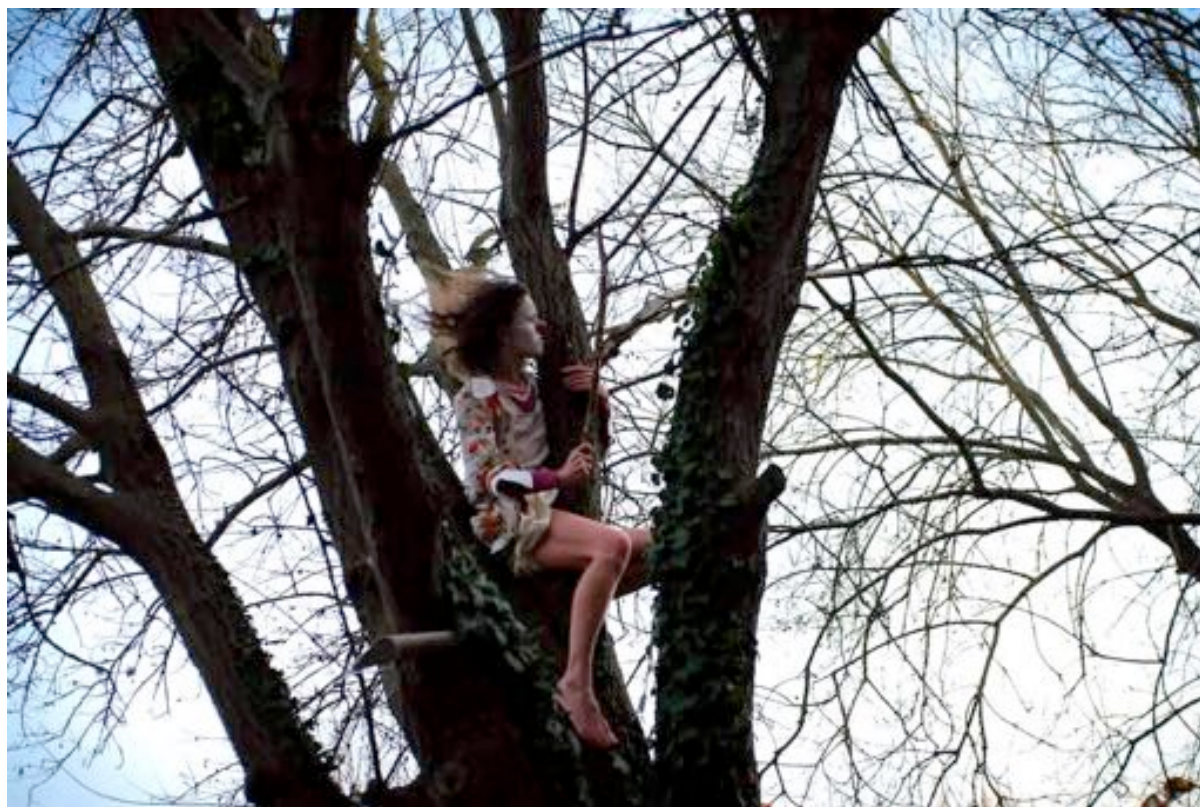
Still standing for culture, La Roseraie, 2020

tout public en intérieur ou extérieur s'adapte aux présent.es