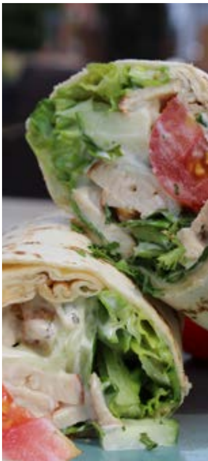
Unsere Wraps werden immer frisch gemacht.

Möglicherweise geht das Wiener Schnitzel auf das Cotoletta alla milanese in Oberitalien zurück, das ähnlich aus etwas dickeren Koteletts zubereitet wird und im 14. oder 15. Jahrhundert seinen Weg nach Wien fand. Dieses ist jedoch nicht belegt. wikipedia.com