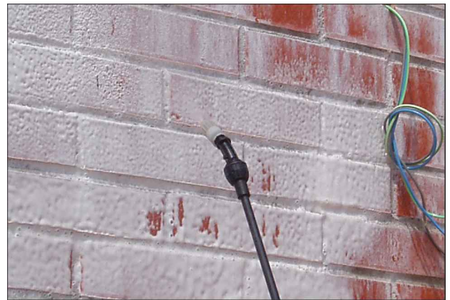
02 Durante la aplicación