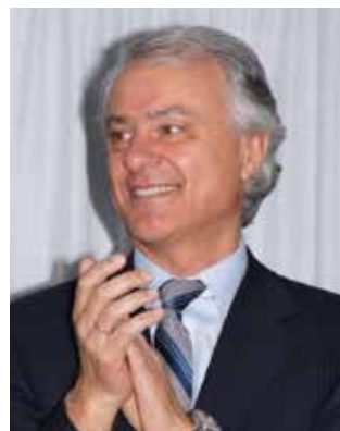
di Stefano Cecchi