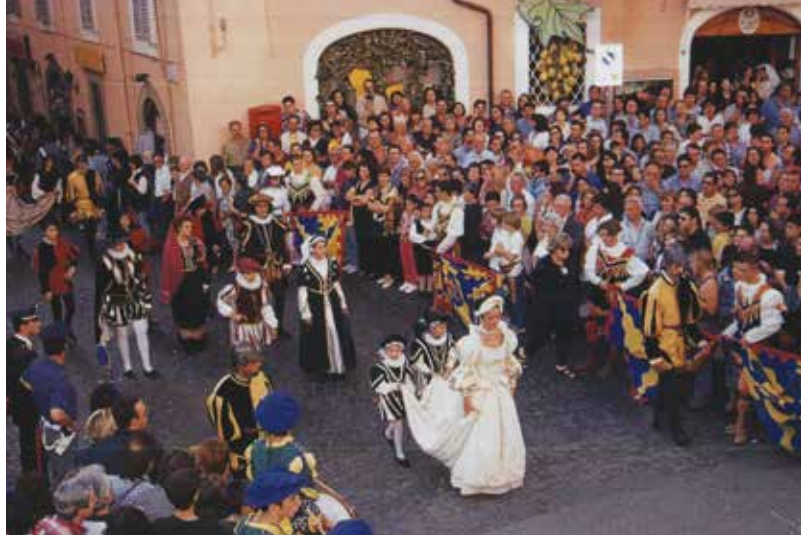
Un momento del Corteo Storico

Nello stesso periodo il Cardinale aveva tracciato il succitato corso, la strada che attraversa la cittadina e alla quale fa da sfondo il Monte Cavo in lontananza.