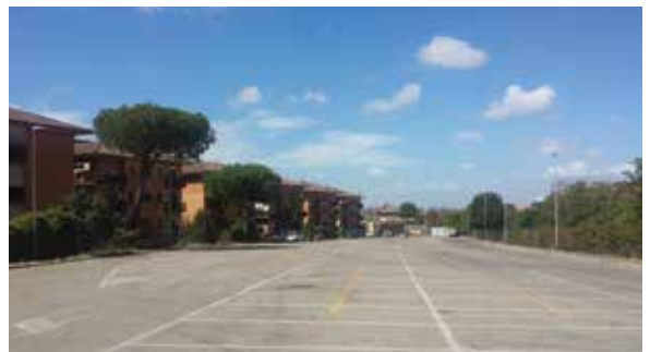
piazza Albino Luciani

In primo luogo, scrivevano Cecchi, Lapunzina e Pisani nella mozione, acquisire al patrimonio comunale piazza Albino Luciani , area vicina alla fermata del treno. Utilizzata solo il mercoledì mattina per il mercato settimanale, doveva essere riservata alla sosta delle auto senza alcun pagamento. Una grande agevolazione per quanti viaggiano in treno, indirizzata anche a favorirne l'uti-