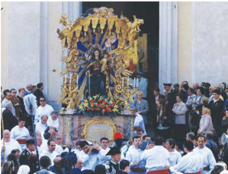
La Statua della Madonna del Rosario esce dalla Basilica di San Barnada per la Processione

In quelle occasioni si aprivano le sale di Palazzo Colonna e il romanista Luigi Jhuetter così racconta: "davvero poteva dirsi che le sale del ferrigno palazzo fervevano di canti e di suoni. Tra quadri e affreschi, tra bronzi e specchiere dorate, ecco grappoli di superlativa squisitezza, soavissime bottiglie di moscato e di aleatico, con boccaletti di gentile fattura dal berci dentro quella grazia di Dio e portarceli via per ricordo".