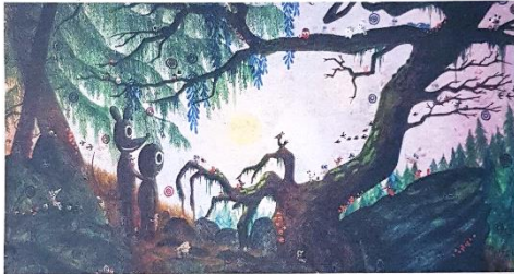
Pulp und seine Freunde bevölkern den Urwald: «Waldgeister am Wasserfall» heisst das Gemälde des Bieler Künstlerpaars M.S. Bastian und Isabelle L. © M.S. Bastian / Isabelle L.