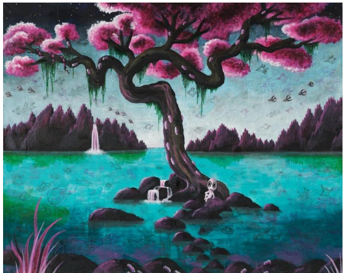
«Lila Pulp»: Pulp entspannt sich unter Kirschblüten. © M.S. Bastian / Isabelle L.

Wer im Spätsommer keine Ferien hat, braucht sich nicht zu grämen. In der Galerie da Mihi ist es nämlich problemlos möglich, gleich mehrere Destinationen zu bereisen. In der Ausstellung «Wonderland» stossen Besucher*innen auf die hochstilisierte Überreiztheit von Millionenstädten wie auf verlassene Orte, tosende Wasserfälle, saftige Lianen und liebeliche Waldgeister. Auch mystische Nachtstimmungen und von Kirschblüten umgrenzte Flusslandschaften locken ganz im Stile Hokusais. Inmitten all dieser paradiesischen Landschaften begegnet einem stets ein forschend-neugieriger Blick. Es ist jener von Pulp: eine weisse, comicartige Figur mit überdimensionalem Kopf.