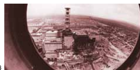
Blick auf Tschernobyl 1986

6. Atomkraft und Menschenrechte: Die Betreiber von Atomanlagen verschleiern die Informationen über die Menge an freigesetzter Strahlung und über die Auswirkung von Unfällen. Durch die irreversiblen Schäden, die sie bereits heute der Natur zugefügt haben und durch die Hypothek des Atommülls bilden die heutigen Atomkraftwerke auch für die zukünftigen Generationen eine gewaltige Bedrohung.