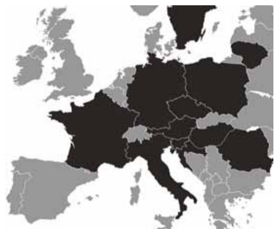
2019: Die Schweiz ist ausgeschlossen aus dem Cross-Border Intraday Markt XBID