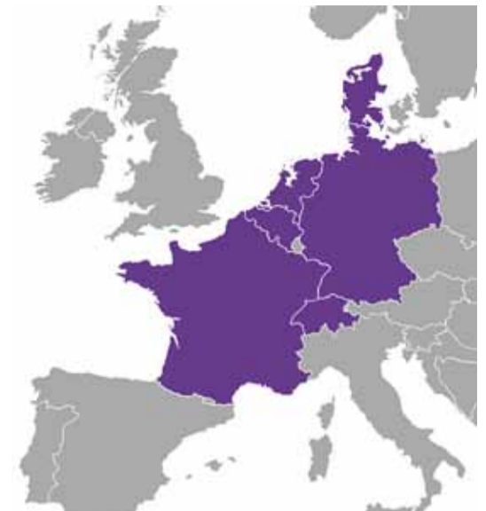
2015: Die Schweiz ist integriert im Cross-Border Intraday Markt via EPEX Spot