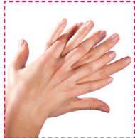
2. Handfläche gegen den Rücken der anderen Hand.