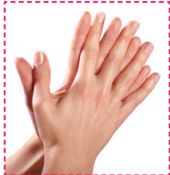
3. Handfläche gegen Handfläche mit ineinander verschränkten Fingern.