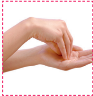
6. Rotierendes Reiben der Fingerspitzen in der anderen Handfläche.