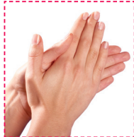
1. Handfläche gegen Handfläche reiben.