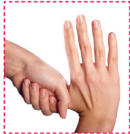
5. Kreisförmiges Reiben des Daumens.