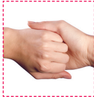
4. Oberseite der Finger gegen die andere Handfläche, die Finger dabei ineinander verkeilt.