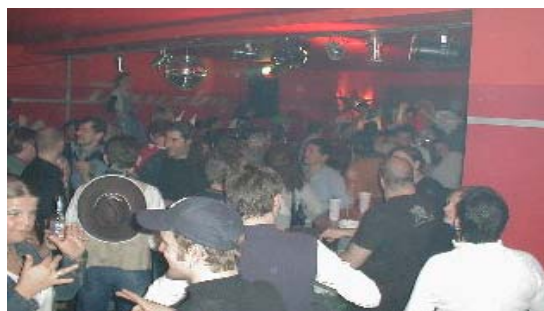
über 100 Gehörlose!!

Am 15.Februar 2003 entfällt der Kinderfasching aus organisatorischen Gründen.