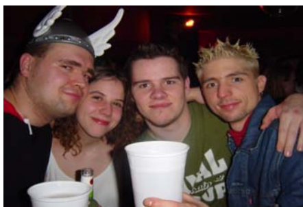
„Thor“ und seine Freunde

Am 01.Februar 2003 war DEAF-KARNEVAL im Druzba in der Kapuzinerstraße 36. Es war die erste Zusammenarbeit mit dem Gehörlosensportclub Linz. Es kamen über 100 Leute zusammen. Musik war cool und laut. Es war eine super Stimmung. Viele Gehörlosen kamen auch nicht ohne Verkleidung! Es wurde bis in der Früh gefeiert, bis der Hahn kräht, aber wir konnten es nicht hören, trotzdem feierten wir im Sportclub-Lokal bis Vormittag weiter. Es war sehr schön und es gab keine Probleme!