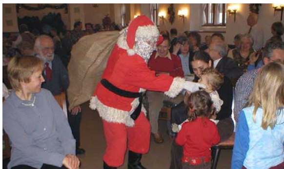
Der Weihnachtsmann kommt!