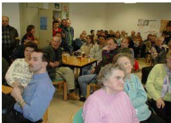
84 Mitglieder waren anwesend.