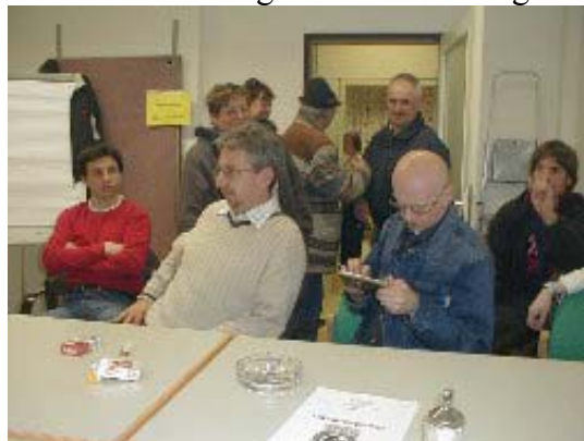
Gemütlicher Abend im Lokal