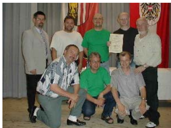
Unser Kegelmansschaft bei der Siegerehrung in Ried/I.