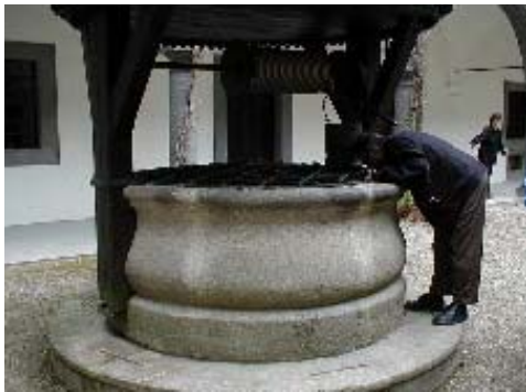
Unser Peter guckt nach unten, ob es unten auch frei ist???