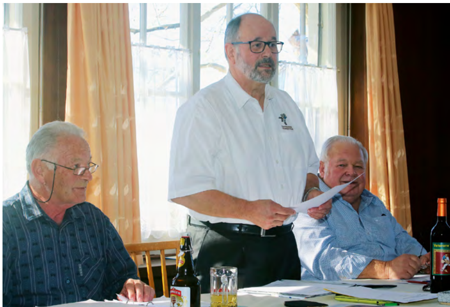
Die Obmannschaft an der Jahrestagung 2019.

In den 75 Jahren ihres Bestehens zählte unsere Vereinigung 36 Obmannschaftsmitglieder, nämlich 11 Obmänner, 12 Schryber und 13 Säckelmeister.