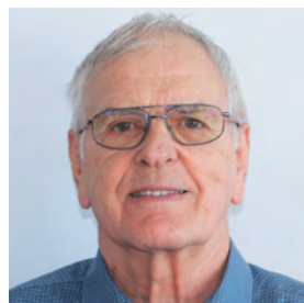
Jost Res Wynigen SK Herzogenbuchsee seit 1997