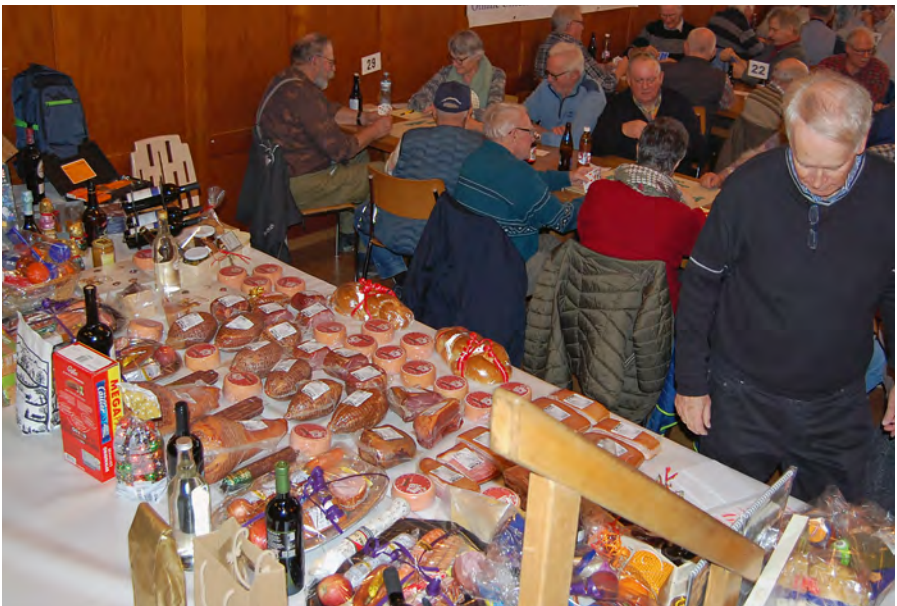
Reich gedeckt: der Gabentisch am Schwingerjass.