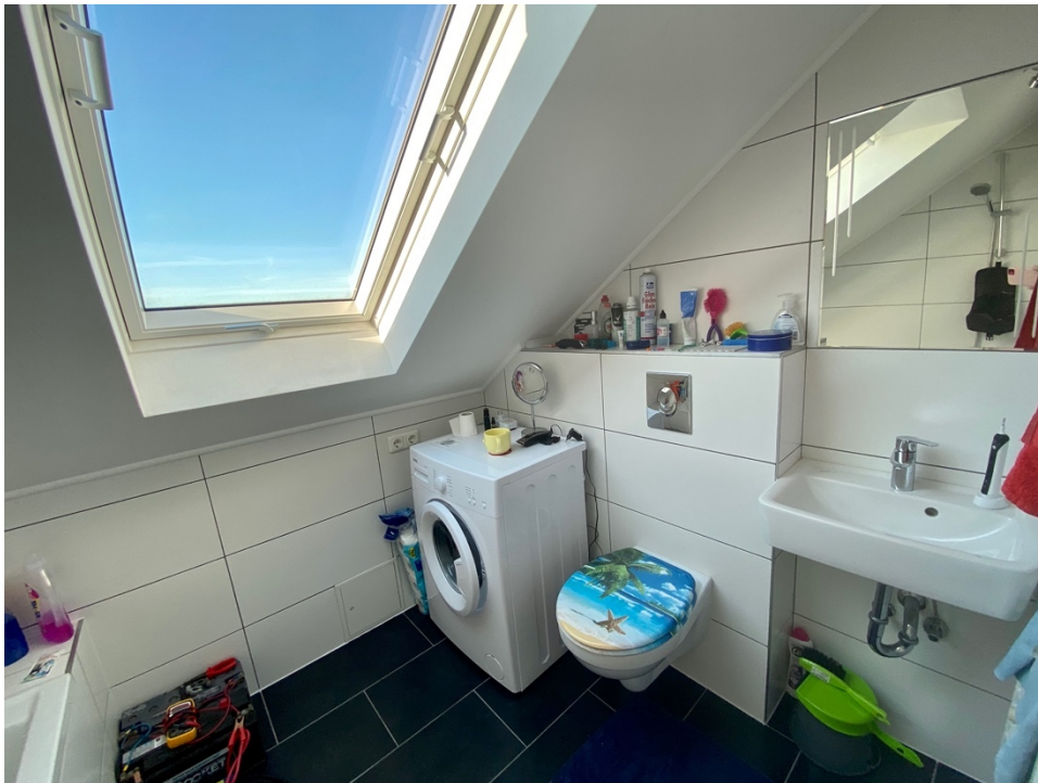
Badezimmer mit Tageslicht