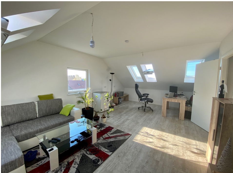
Blick in Richtung Küchennische