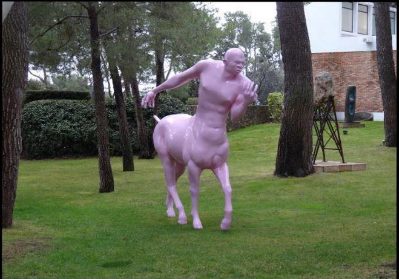
Assan Smati - le Centaure - 2008