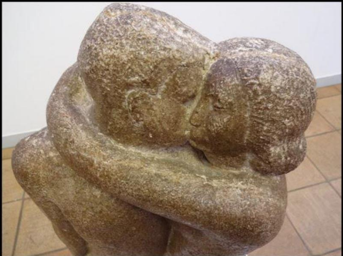
René Collamarini - Le baiser - 1927