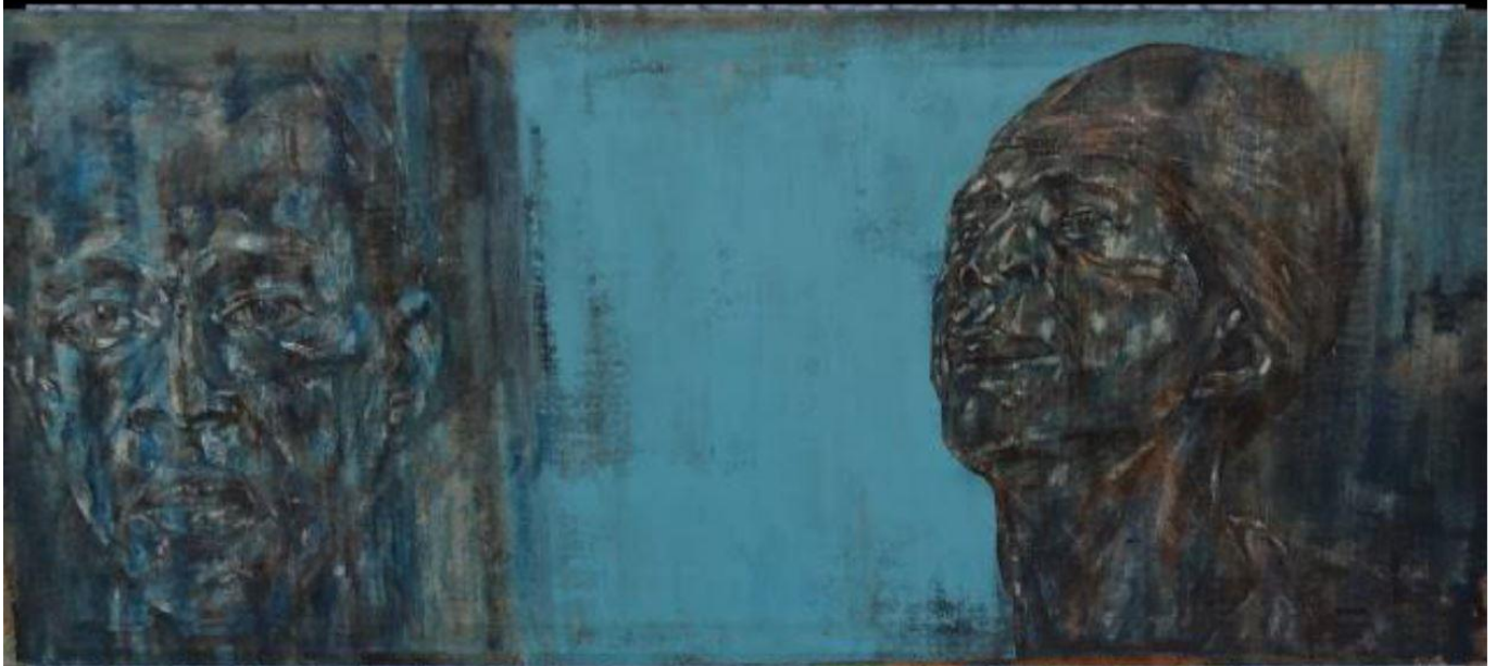
Léon Golub : 2 Black Men - 1990