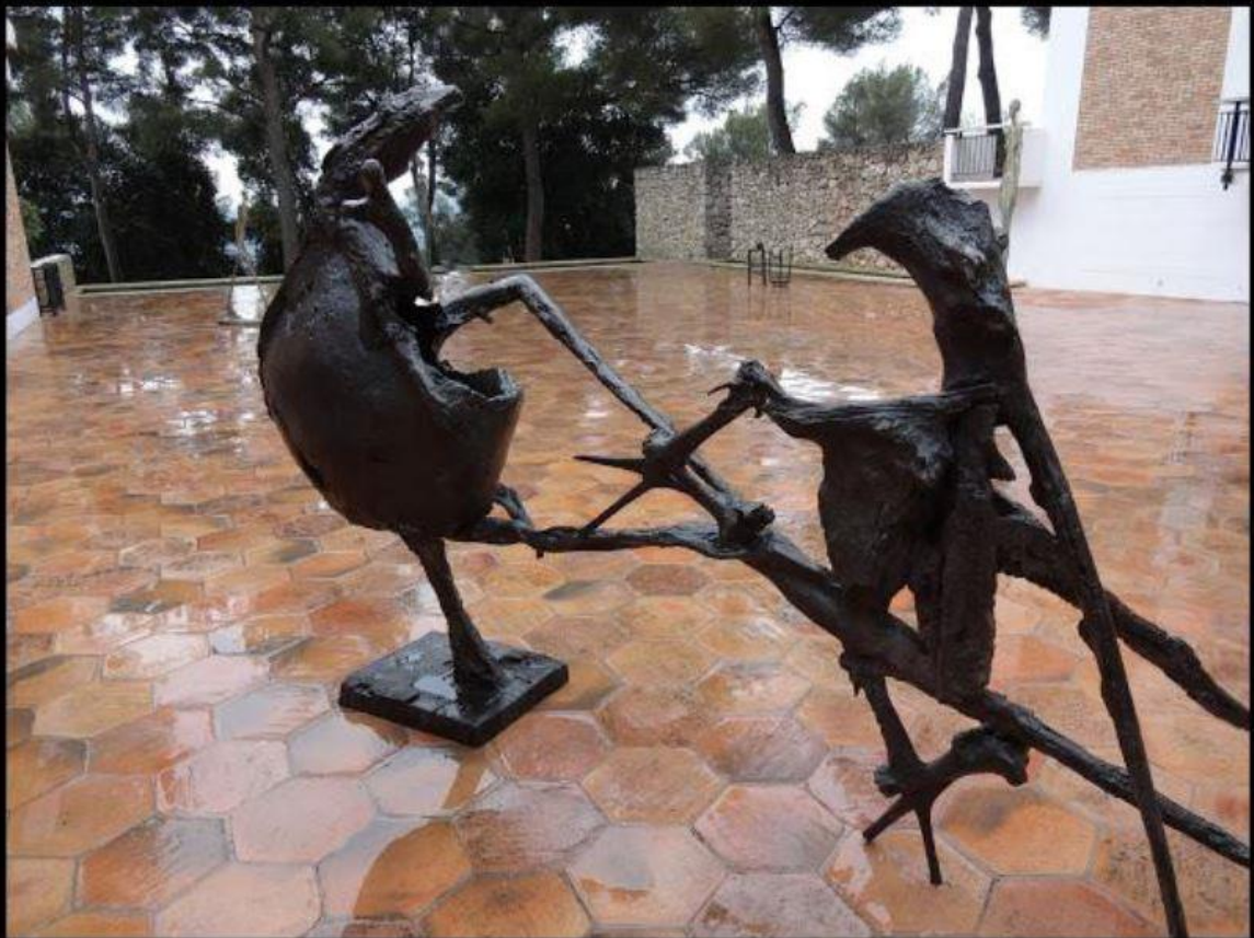
Germaine Richier - la montagne- 1955-1956