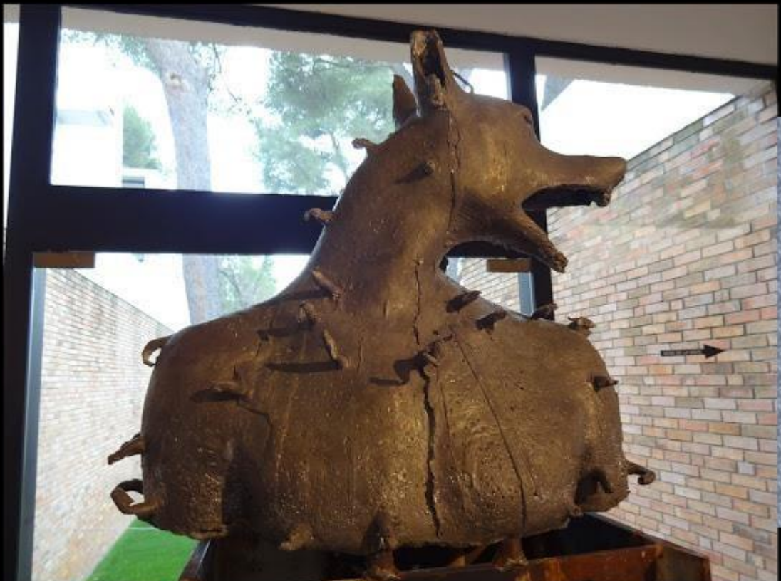
Assan Smati - Paria - 2007