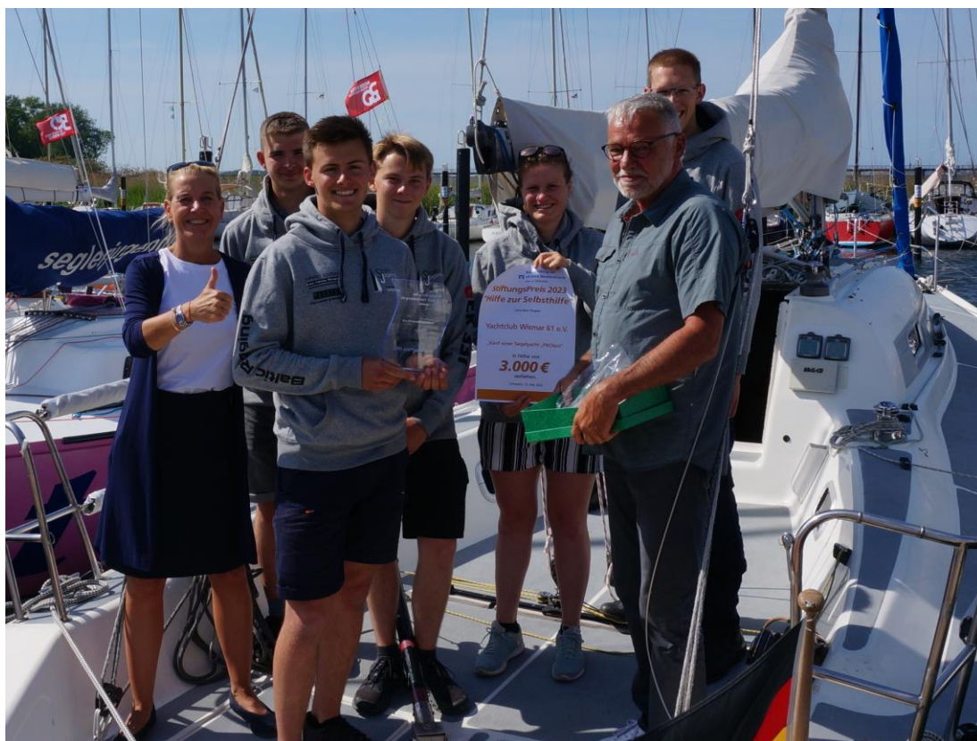
Besuch beim Schulförderverein der Insel Poel e.V.

Preisverleihung beim „Yachtclub Wismar 61 e. V.“ in Wismar