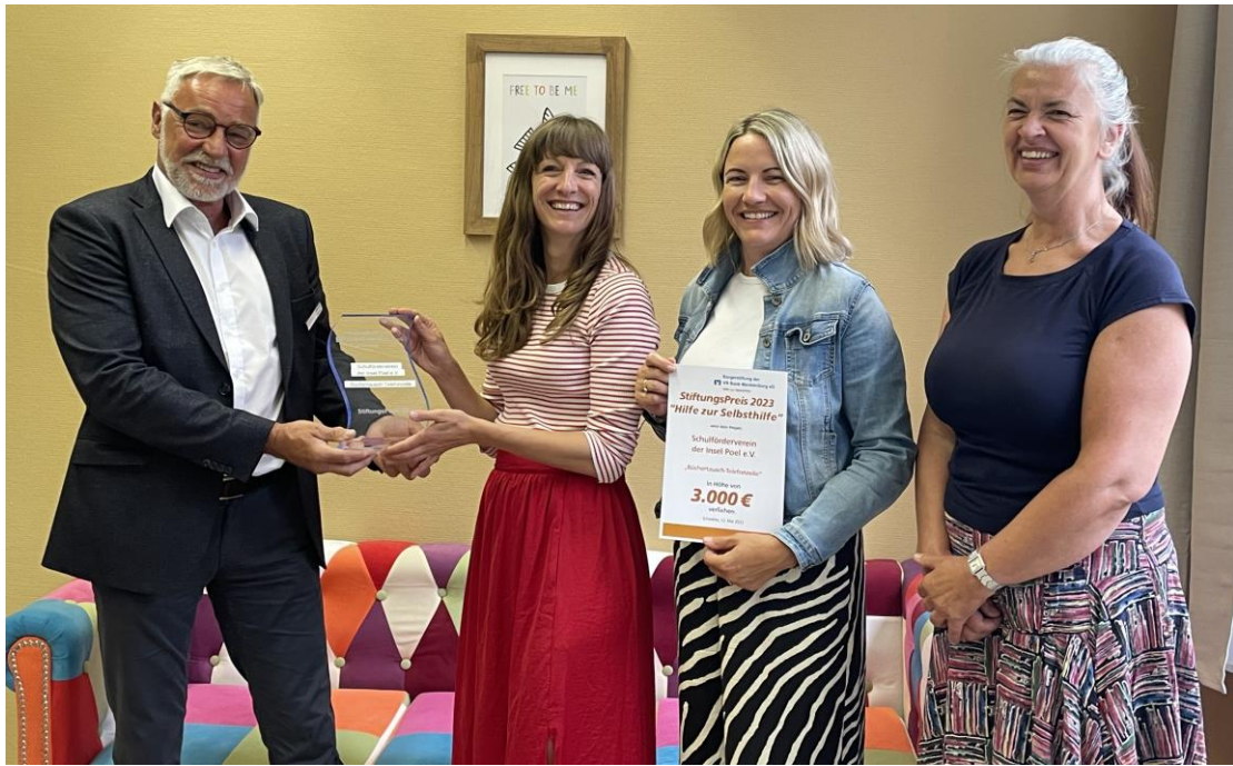
Schulverein zur Förderung der Grundschule Dabel e. V. freut sich über die Unterstützung durch die Bürgerstiftung der VR Bank Mecklenburg eG