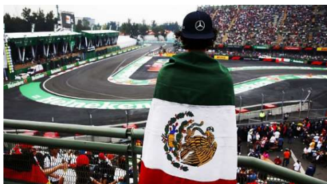
Stadionansicht der Strecke in Mexiko

Wie EnergyInform sich am Ende im Rennen geschlagen hat und ob es in Mexiko zum ersten Regenrennen kam erfahrt ihr in den folgenden Artikeln.