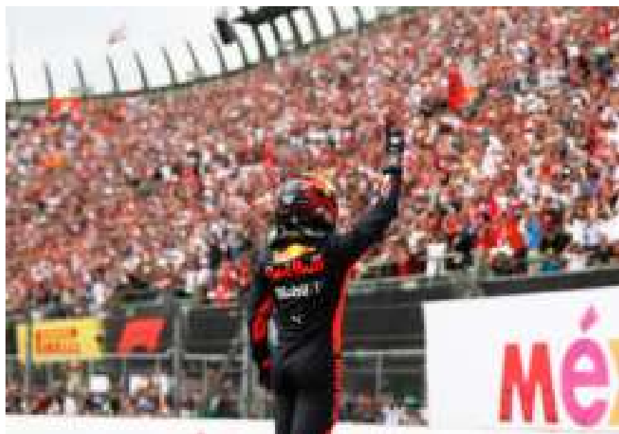
RedBull. Das dominierende Team des GP von Mexiko