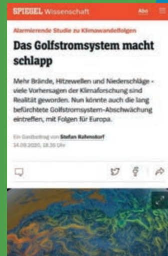
Der GAU im GAU: Golfstrom in Gefahr

Die öffentliche Wahrnehmung der Bedrohungslage und damit verbunden die Einstellung zum konventionellen Konsum ist dabei, sich grundlegend zu verändern. Gesucht und gefunden werden Unternehmen, Produkte und politische Entscheider, mit deren Hilfe Menschen von der Seite des Problems auf die Seite der Lösung wechseln können. Drohende Gefahren, angekündigte gesetzliche Verschärfungen und die sich schnell verändernden Prioritäten der Konsumenten bedeuten Chancen und Herausforderungen für Unternehmen und Kommunen. Hier setzt ORCA an.