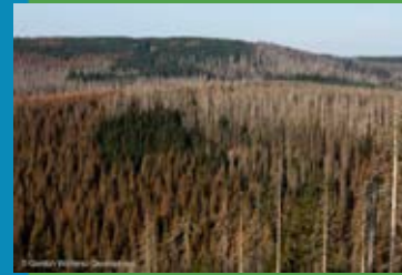
Waldschäden: Harz 2020

Viele Regierungen, darunter Deutschland, Japan und Korea, haben angekündigt oder beschlossen, bis 2050 klimaneutral zu werden. Die EU beschließt eine CO-Reduzierung um 55% bereits bis 2030. Weiter reichendes wird diskutiert, so zum Beispiel das Ende von Benzin-, Diesel- und Erdgas-Verbrennungsmotoren bis 2025 bzw. 2030.