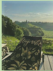
Ausblick vom Pool

Zimmer sind beim Partnerbetrieb zu buchen und zu bezahlen, es gelten die Stornobedingungen des Partnerbetriebes.