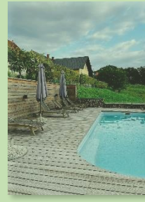
Pool mit Liegefläche