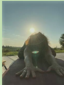
Yoga im Freien