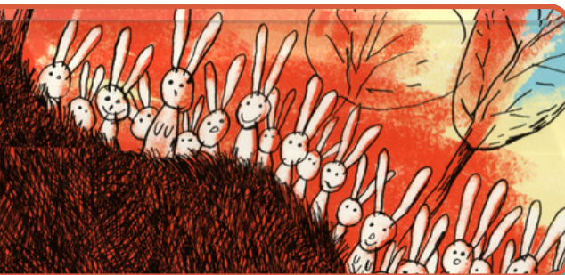
Création dessin : Roland Baden Pour la Peau du pou

Pour retrouver tous les spectacles de Pierre Delye Site : pierredelye.com