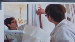
LES MÉTIERS D'ART P.52-53