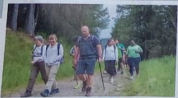
LA MONTAGNE L'ÉTÉ P.22-23