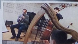
L'ÉDUCATION MUSICALE P.44-45