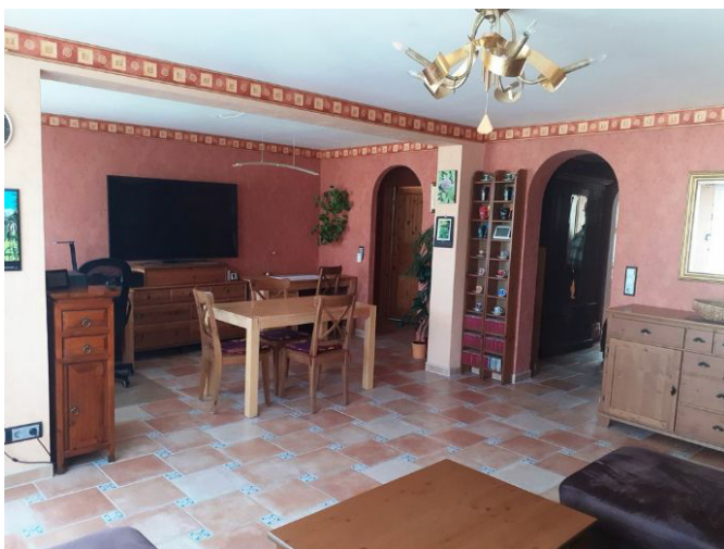
Wohnen-Essen Bild 2