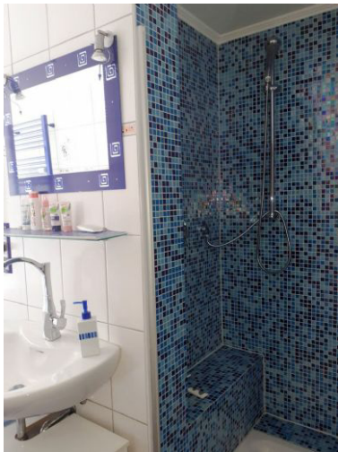
Tageslichtbad Bild 2