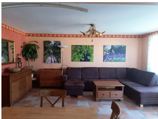
Wohnen Bild 2