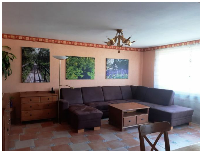
Wohnen Bild 1