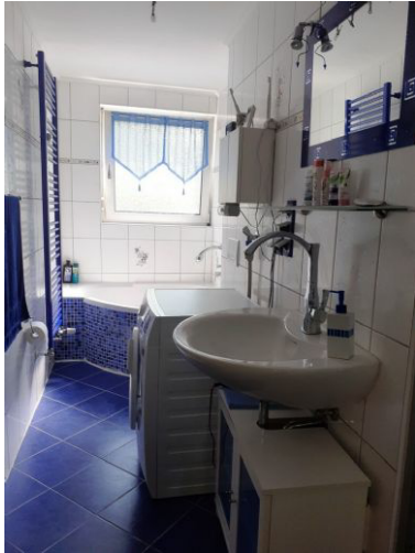
Tageslichtbad Bild 1