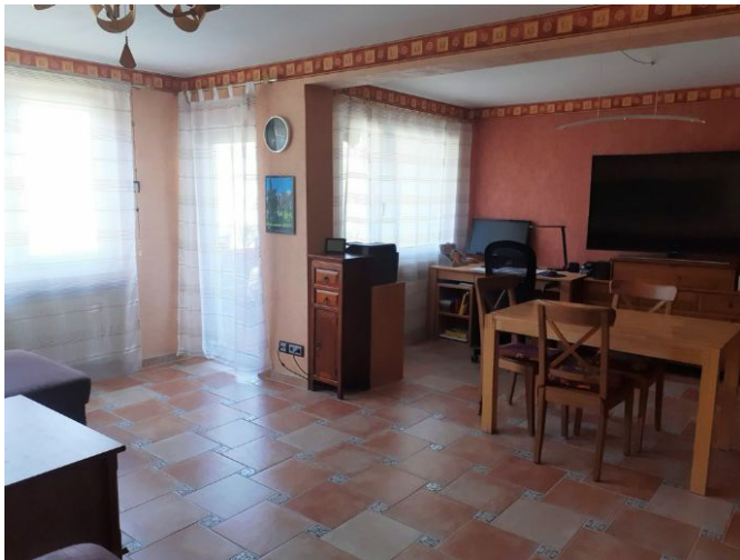
Wohnen-Essen Bild 1