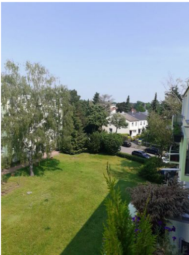
Blick vom Balkon