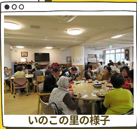
いのこの里の様子