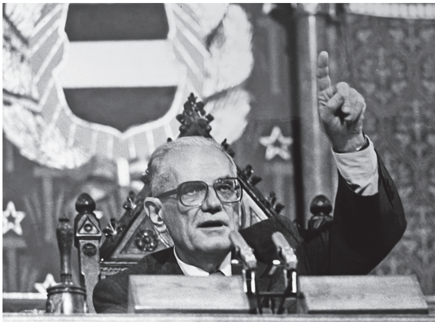
Sarlós István, von der Familie nur «Ipi» genannt, war mein Grossonkel und während der kommunistischen Zeit der Parlamentspräsident von Ungarn.