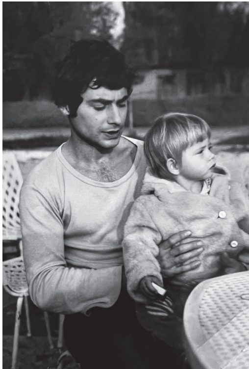
«Apu», mein Vater, und ich noch in Ungarn. Er war ein Lebemann, liebte die Gesellschaft von Frauen und pflegte «Ipi» bis zu seinem Tod.