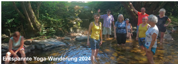
Entspannte Yoga-Wanderung 2024