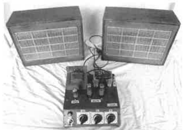
Le troisième amplificateur stéréo