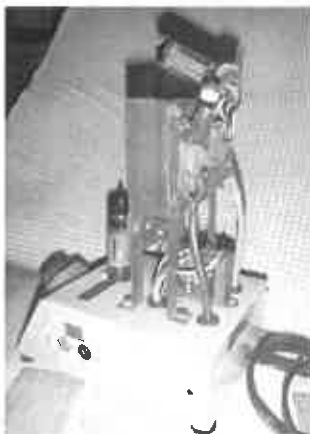
Le second amplificateur

Enfin, un troisième exemplaire, mais cette fois en version stéréophonique 2 x 2 watts.