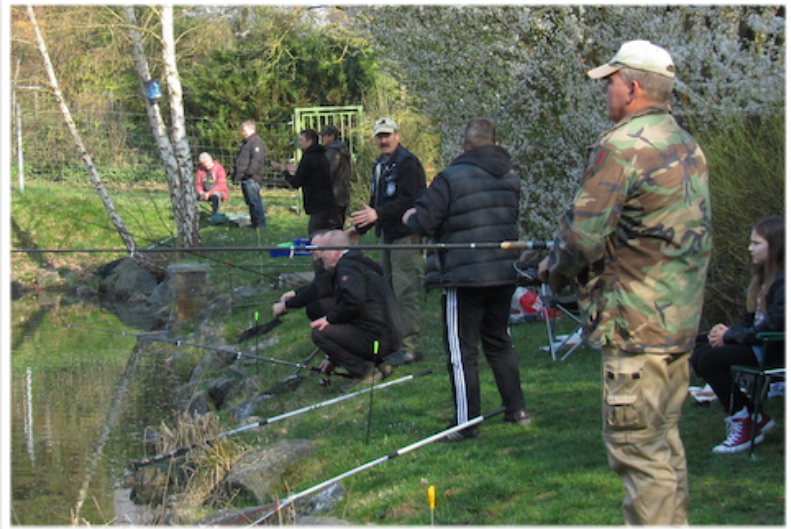
Ganz schön was los!