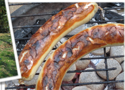
Zwei perfekte Würstchen!