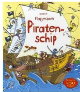
Piraten-schip: flapjesboek Stefano Tognetti