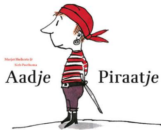
Aadje Piraatje (verschillende delen) Marjet Huiberts