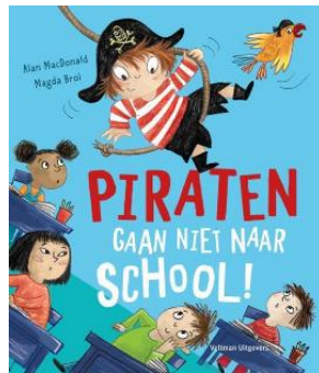
Piraten gaan niet naar school! Alan Macdonald