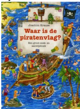
Waar is de piratenvlag? Joachim Krause