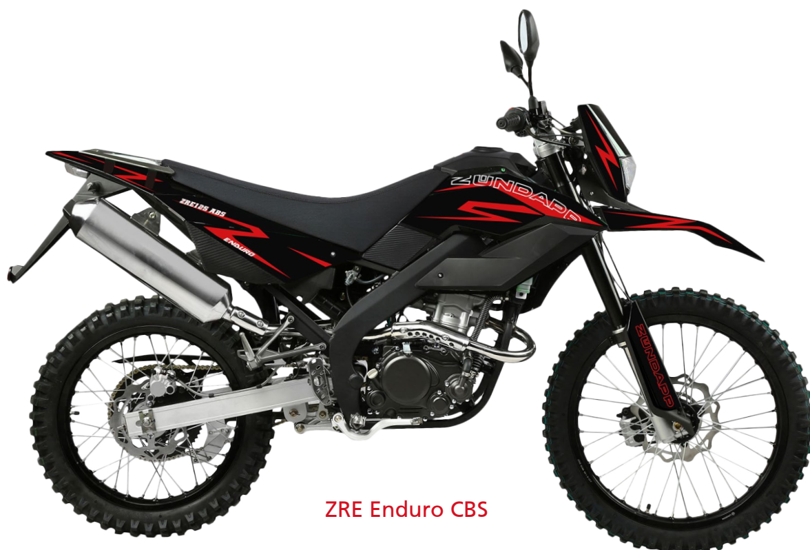
ZRE Enduro CBS