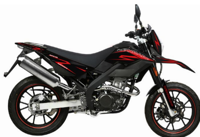
ZRM Supermoto ABS