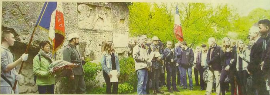
Dépôt de gerbe, discours et minute de silence au dernier des quatre jours du projet du collège Paul Eluard de Noyon, aux carrières de la Botte de Connectancourt et de Montigny à Machemont, vendredi 30 avril.

Ici (à gauche), un exemple de sculpture du site de Machemont sur lequel les élèves ont dû travailler dans ce projet multidisciplinaire.