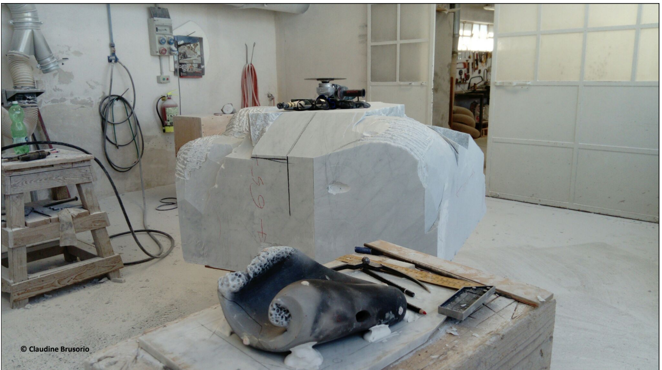
Le bloc de marbre est débité sur place pour être allégé