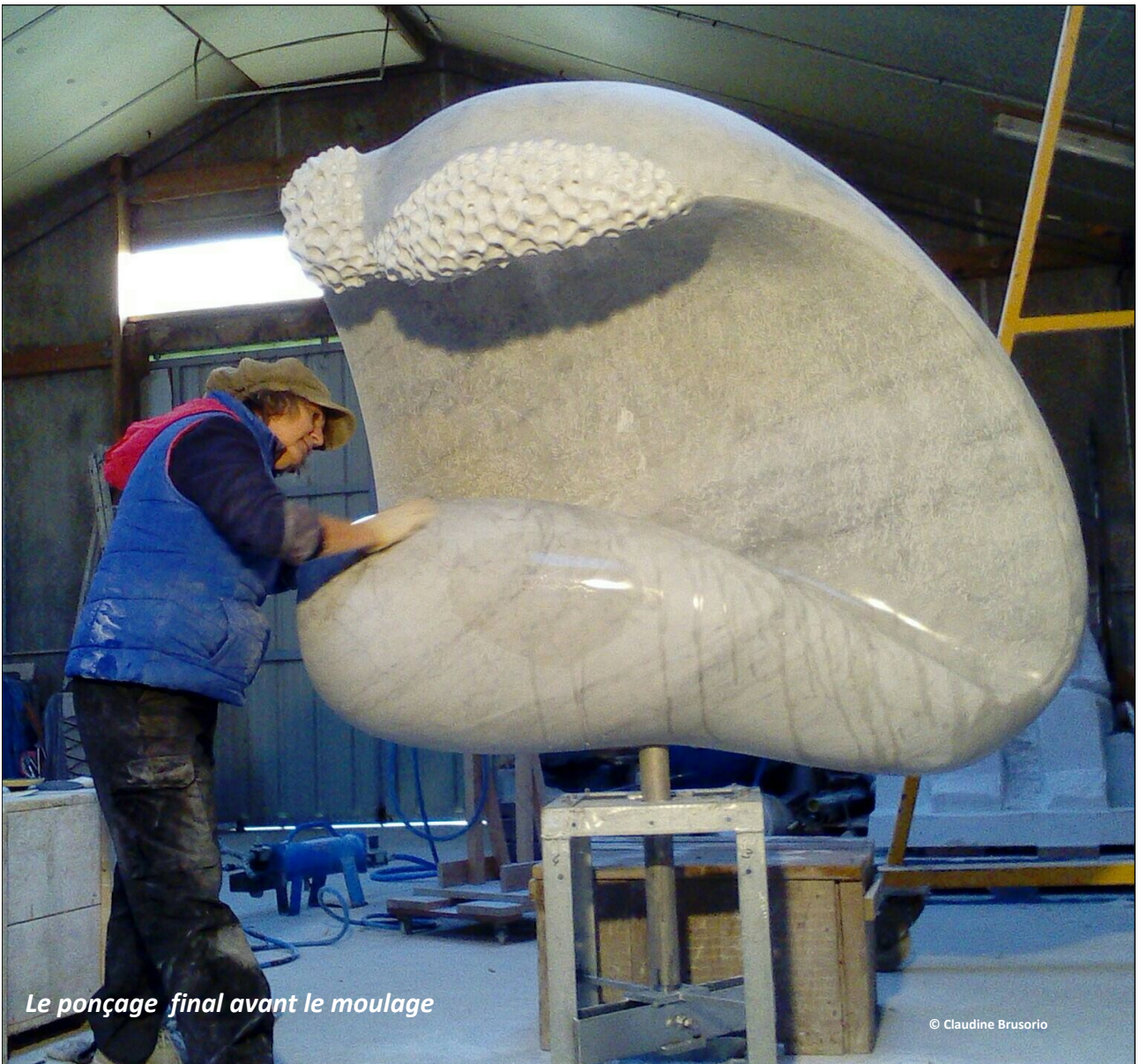
Le ponçage final avant le moulage