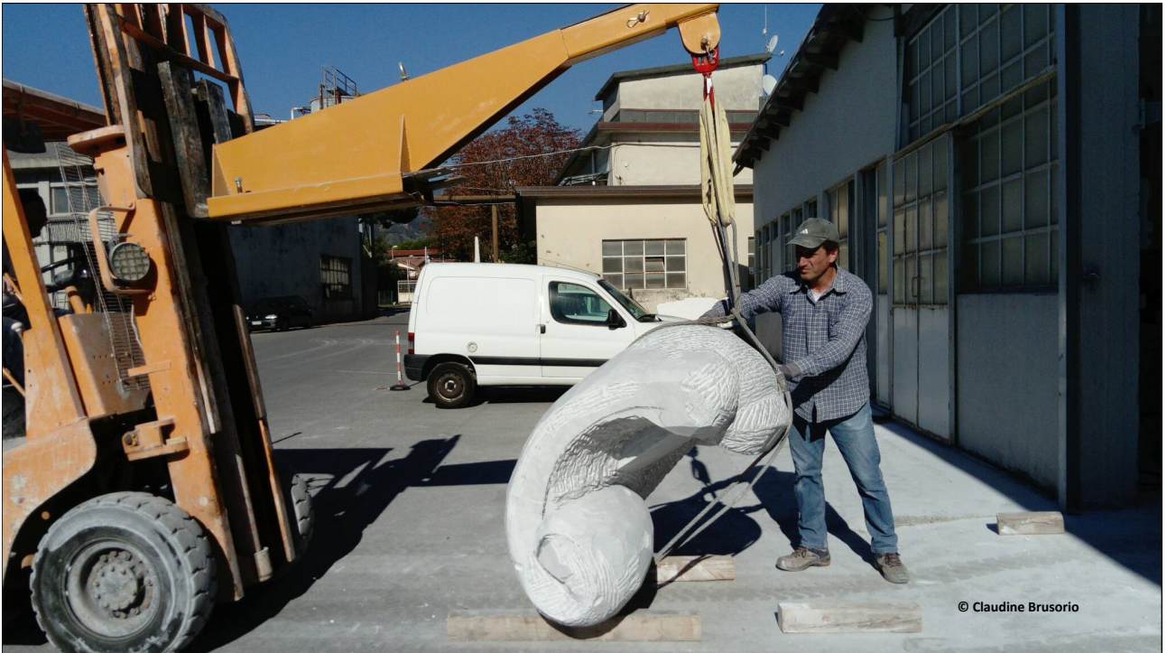
La partié ébauchée est retournée puis chargée dans un camion en Italie avant de mettre le cap sur la France