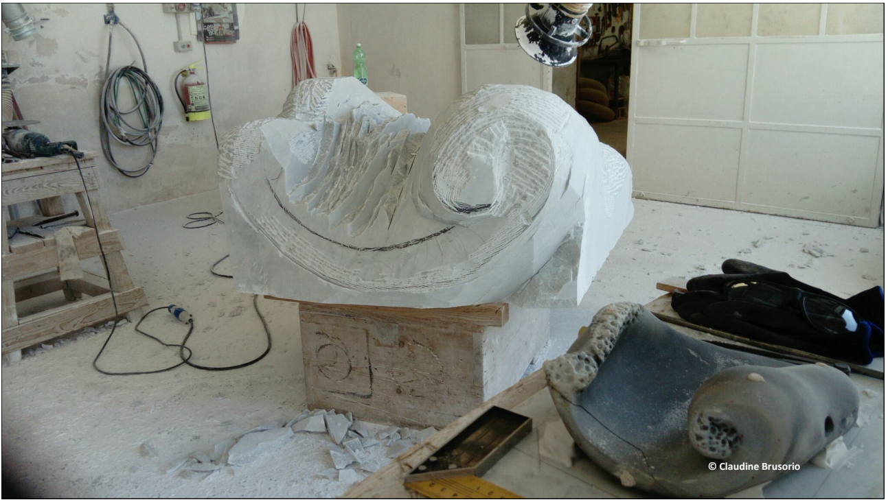
La Vague commence à prendre forme à Carrare près de la maquette en terre cuite, à droite