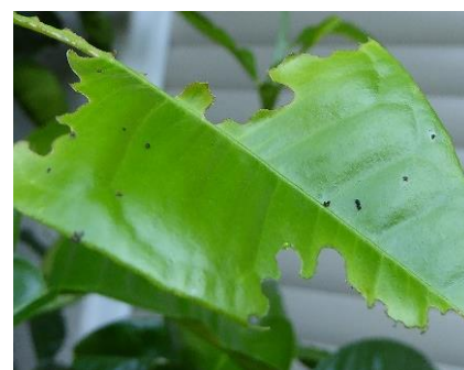
Blattverlust durch Raupenfraß - Kotkrümel erkennbar