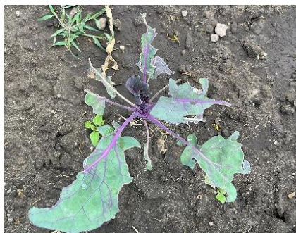
Vogelfraß an Kohlrabi blättern