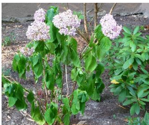
Hortensie mit Trockenstress

Kombiniert mit einer guten Mulchauflage und/oder Bepflanzung mit schattenspendenden Bodendeckern lässt sich die Verdunstung auf Beeten und in Gehölzstreifen reduzieren. Wer rechtzeitig darauf verzichtet, seine Pflanzen mit einer Luxusversorgung zu verwöhnen, hat stabilere, weniger mastige Pflanzen, die der Trockenheit besser trotzen. Und schlaffe Blätter sind bei Hitze „erlaubt“. Pflanzen reduzieren so ihre Blattfläche, die der Sonne ausgesetzt ist, und vermindern die Transpiration.