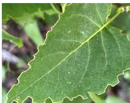
Buchtenfraß an Blättern von Gehölzen durch Rüsselkäferarten