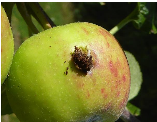
Apfelwicklerbefall - madiger Apfel

Aktuell kann man jetzt schon die Qualität der Apfelernte beeinflussen. Einige Äpfel zeigen bereits schon jetzt Schadstellen oder sind verkrüppelt und deformiert.