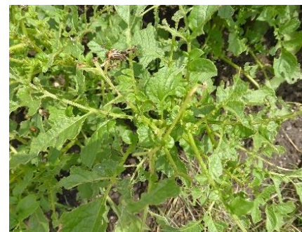
Blattfraß durch Kartoffelkäfer und deren Larven