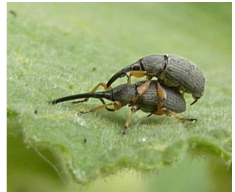
oben Männchen, unten Weibchen

Hinter diesem aparten Namen versteckt sich ein kleines Insekt mit auffälligem Körperbau. Das sollte aber nicht darüber hinwegtäuschen, dass dieser nur 3 mm große Rüsselkäfer massive Schäden an den Knospen von Stockrosen verursacht und dadurch oft nur sehr wenige Blüten aufgehen. Über viele Wochen sind die Käfer zu mehreren auf den Knospen zu finden. Das Weibchen bohrt mit seinem körperlangen Rüssel zur Eiablage einen Bohrgang in die Knospen. Die Larven ernähren sich von den Blüten- und Samenanlagen, sodass sich die Knospen nicht weiterentwickeln und in der Folge vertrocknen. Nach 4 bis 6 Wochen schlüpft die nächste Käfergeneration, verursacht tolerierbaren Lochfraß auf den Blättern und überdauert später den Winter in der Bodenstreu.