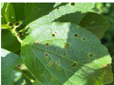
Lochbildung durch die Schrotschusskrankheit an Steinobst