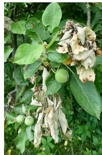
Monilia - Triebspitzendürre am Apfelbaum

Um eine gute Qualität zu sichern und vor allem dem Befall von Fruchtfäule vorzubeugen, ist jetzt ein gezieltes Auspflücken aller geschädigten Äpfel empfehlenswert. Die Larven des Apfelwicklers sind zur Verpuppung aus den Früchten bereits herausgewandert, erkennbar an den Löchern mit anhaftendem Kothäufchen. Andere Früchte können durch den Schorfbefall geschädigt werden. Auf diesen entwickelt sich sehr schnell die Fruchtfäule. Der starke Blattlausbefall hat bei einigen Apfelsorten zu deformierten oder verkrüppelten Früchten geführt. Auch diese sollten entfernt werden.