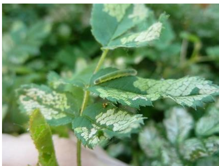
Skelettierfraß an Rosenblättern durch Larven von Blattwespen