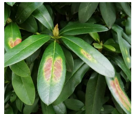
Sonnenbrand auf Rhododendronblättern nach Gehölzrückschnitt