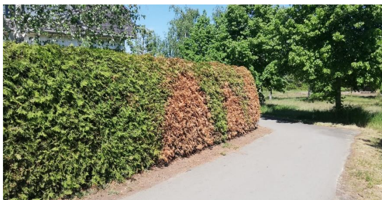
Trockenschaden an Thujahecke

Wassersparendes Gießen ist ein erster Schritt, wenn Wasser knapper wird. Zusätzlich muss bei der Gartengestaltung und Pflanzenauswahl das sich ändernde Klima noch mehr berücksichtigt werden: „heute pflanzen, was morgen noch wachsen kann“.