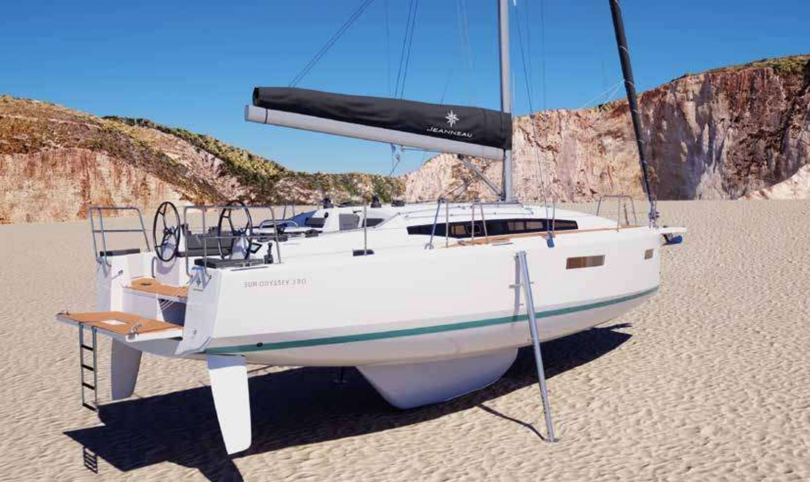
▲ Racy and modern lines Des lignes racées et modernes Racy und moderne Linien Líneas modernas Linee moderne