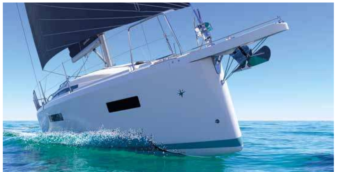
► Racy and modern lines Des lignes racées et modernes Racy und moderne Linien Líneas modernas Linee moderne