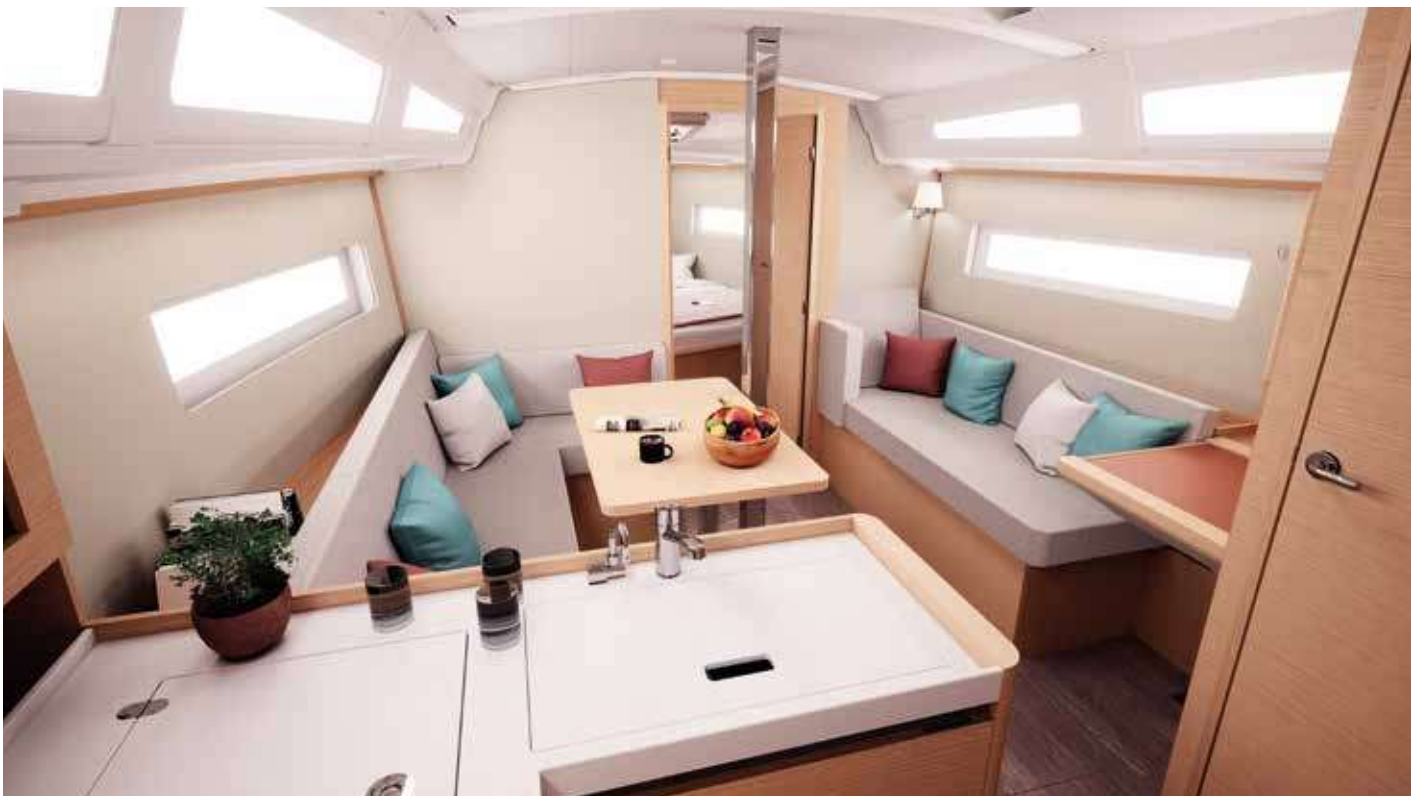
▼ A sofa on the starboard side that invites you to relax Un sofa sur tribord qui invite à la détente Ein Sofa auf der Steuerbordseite, das zum Entspannen einlädt Un sofá a estribor que invita a relajarse Un divano a dritta che vi invita a rilassarvi