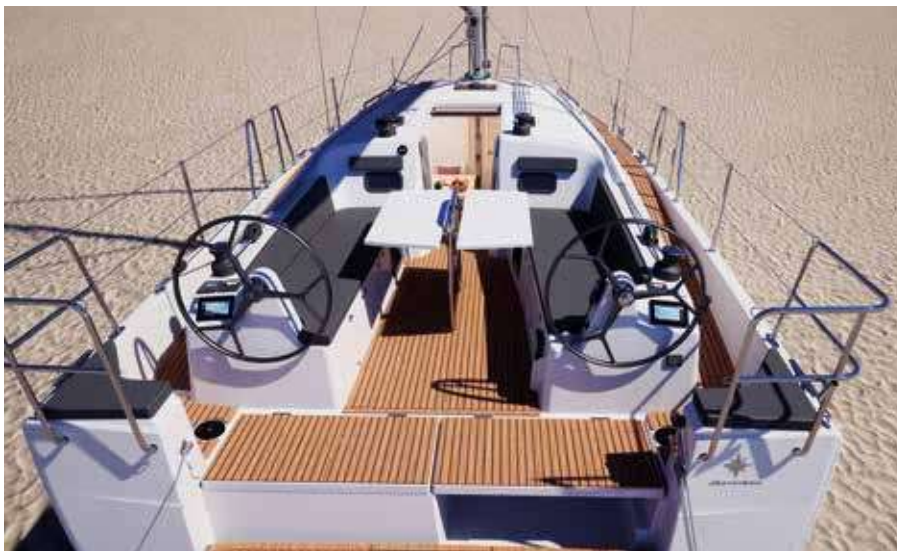
▲ A fully equiped cockpit Un cockpit très bien équipé Ein voll ausgestattetes Cockpit Una carlinga muy bien equipada Un pozzetto completamente attrezzato