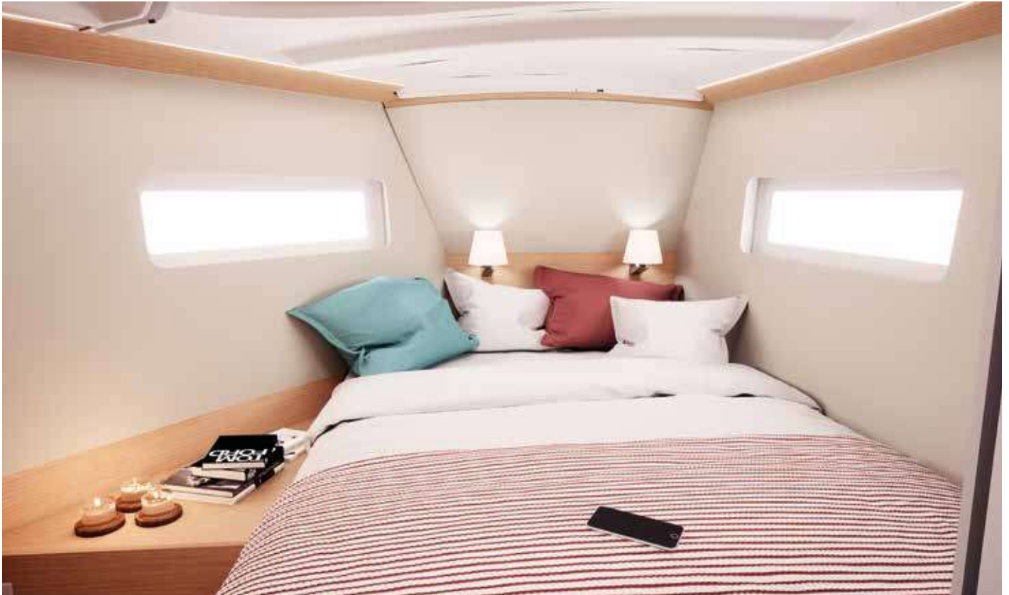
▲ Large and comfortable front owner's cabin with rectangular berth Grande et confortable cabine propriétaire avant, avec lit rectangulaire Große und komfortable vordere Eignerkabine mit rechteckigem Bett Amplio y confortable camarote de armador en proa con cama rectangular Cabina armatoriale di prua ampia e confortevole con letto rettangolare