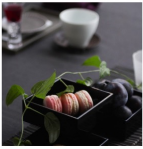
TABLE & SWEETS