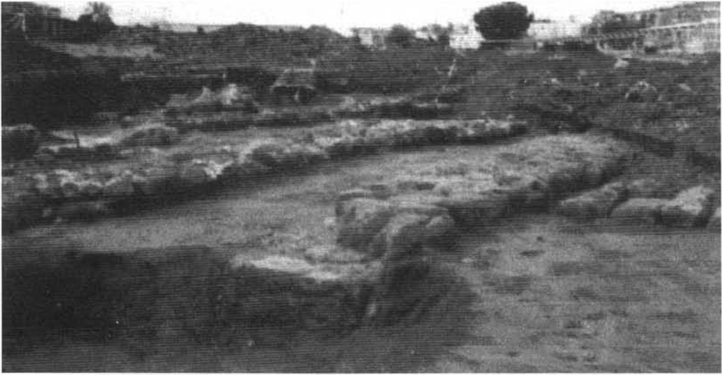
Fotografía de los cimientos de las plantas del as crujías del Dar al-Tiraz.

En dicho arrabal estaba la tumba de san Zoilo en la iglesia del Tiraz ( kanisa al-Tirāz ) 47 . Esta basílica puede situarse en la aula tricora norte del edificio excavado en Cercadilla y que antes aludimos y que están a unos 500m. al Oeste de este edificio que identificamos como Dar al-Tiraz. Para esta identificación voy a estudiar la ubicación de los restos de san Zoilo mártir en la iglesia existente en este arrabal del Tirāz según las fuentes históricas.