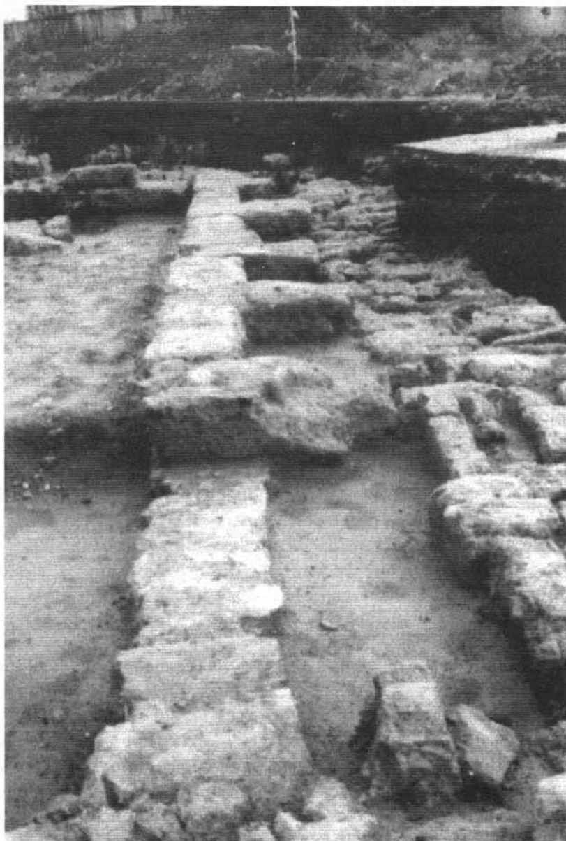
Restos de los cimientos de las plantas de las crujías del Tiraz.

El lugar donde se han excavado los restos, que suponemos 44 son de Dār al-Tiraz, esta al norte de la antigua Estación del FFCC y al NO de dicha puerta de Bāb al-Yahud, en el solar de la antigua Fábrica de harinas de San Rafael según el plano de Córdoba de 1884 de Dionisio Casañal. El arrabal de Ummm Salama es llamado por Ibn al-Jatib de Qut Rasah. Es probable que el nombre de Umm Salama acabara con el tiempo por suplantarse al antiguo nombre de arrabal de los Bordadores o Tejedores (rabad al-Tarrazin o rabaḍ al-Tirāz) o vicus tiraceorum 45 según el Calendario de Córdoba 46 .