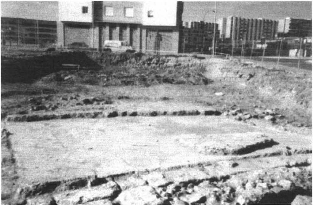
Restos de una alberca de factura tardoromana reutilizada en Vista Alegre.