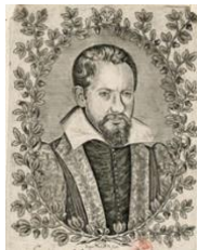
Charles Loyseau (1566-1627)

Avocat au Parlement de Paris, comme son père, il est aussi juriste. Il est nommé comme représentant du roi Henri IV à Sens et à Châteaudun. En 1610, il rédige un Traité des ordres et simples dignités dans lequel il décrit la société, divisée en trois ordres, qu'il appelle « états ». Ses œuvres sont publiées après sa mort en 1660.