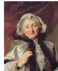
Marie-Thérèse Geoffrin (1699-1777)

Issue de la noblesse, elle passe vingt ans au couvent puis s'installe à Paris en 1711. Elle est introduite à la cour de Louis XIV et, à partir de 1718, elle ouvre l'un des salons littéraires les plus réputés de l'époque appelé « Le bureau d'esprit ». D'abord consacré à la politique et à la finance, ce salon devient littéraire à partir de 1733.