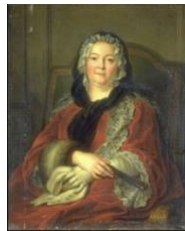
Claudine Guérin de Tencin (1682-1749)

Avocat au Parlement de Paris, comme son père, il est aussi juriste. Il est nommé comme représentant du roi Henri IV à Sens et à Châteaudun. En 1610, il rédige un Traité des ordres et simples dignités dans lequel il décrit la société, divisée en trois ordres, qu'il appelle « états ». Ses œuvres sont publiées après sa mort en 1660.