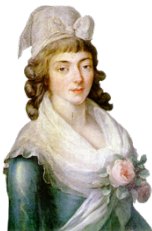
Manon Roland (1754-1793)

Fille d'un graveur, elle reçoit une éducation très poussée et épouse, en 1780, Jean-Marie Roland de La Platière, chef du futur parti girondin, qui devient Ministre de l'Intérieur en 1792. Soutenant la carrière de son mari, elle reçoit dans son salon les députés girondins. Elle est victime montagnarde et est exécutée le 8 novembre 1793.