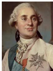
Louis XVI (1754-1793)

Fille d'un graveur, elle reçoit une éducation très poussée et épouse, en 1780, Jean-Marie Roland de La Platière, chef du futur parti girondin, qui devient Ministre de l'Intérieur en 1792. Soutenant la carrière de son mari, elle reçoit dans son salon les députés girondins. Elle est victime montagnarde et est exécutée le 8 novembre 1793.