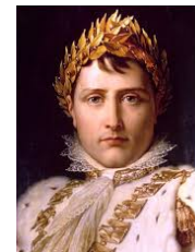
Napoléon Bonaparte (1769-1821)

Petit-fils de Louis XV, roi en 1774, il accepte de réunir les États généraux en 1789 mais se rallie difficilement à la monarchie constitutionnelle. Sa tentative de fuite et son attitude ambiguë face à la guerre accroissent son impopularité. Il est détrôné le 10 août 1792, jugé puis condamné et exécuté le 21 janvier 1793.