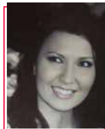
Membro Osservatorio Violenza di Genere e Suicidio

“È che dietro le cose ci sei tu, Primavera, che incominci a scrivere nell'umidità, con dita di bambina giocherellona, il delirante alfabeto del tempo che ritorna.” (PABLO NERUDA)