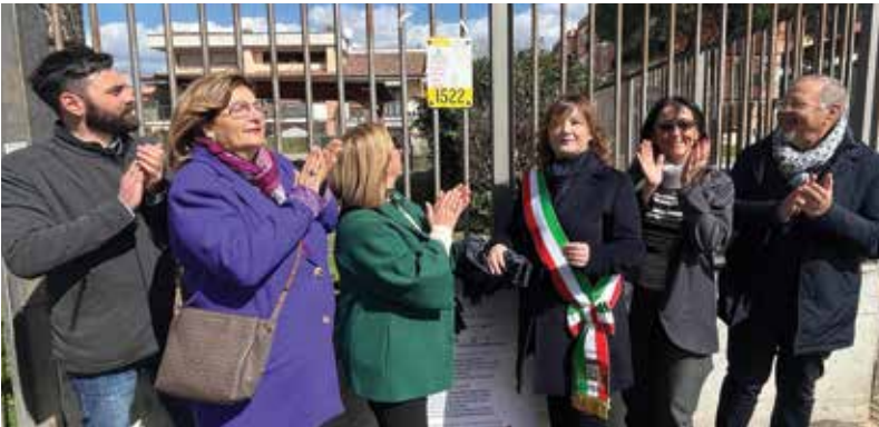
L'Amministrazione comunale scopre la targa con il numero anti violenza 1522 al Parco della Pace

A chiudere la giornata, presso il Museo Civico "Umberto Mastroianni" l'apertura della mostra contemporanea collettiva "I mille volti di Vittoria Colonna", che rimarrà aperta fino al 29 marzo, promossa dall'Assessorato alla Cultura e realizzata da 'Medina Art Gallery'.