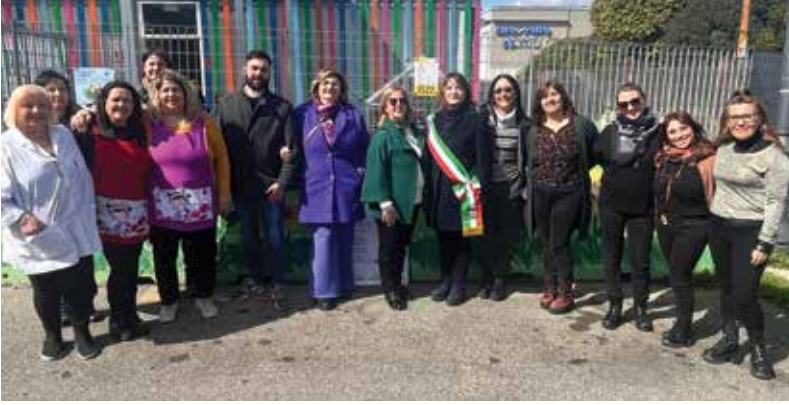
L'Amministrazione comunale con il personale della scuola Anna Frank durante la promozione del numero anti violenza 1522