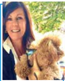
Assessore alle Politiche degli Animali Comune di Marino

A nche quest'anno sarà possibile usufruire del bonus per gli animali domestici. Questa iniziativa gestita dal Ministero della Salute, nasce per sostenere i proprietari di animali da compagnia ad ammortizzare le spese che riguardano il pagamento di visite veterinarie, le operazioni chirurgiche veterinarie e l'acquisto di farmaci che non tutti possono permettersi visto i costi piuttosto elevati.