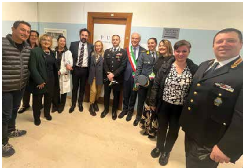
L'apertura dello sportello anti violenza all'ospedale San Giuseppe