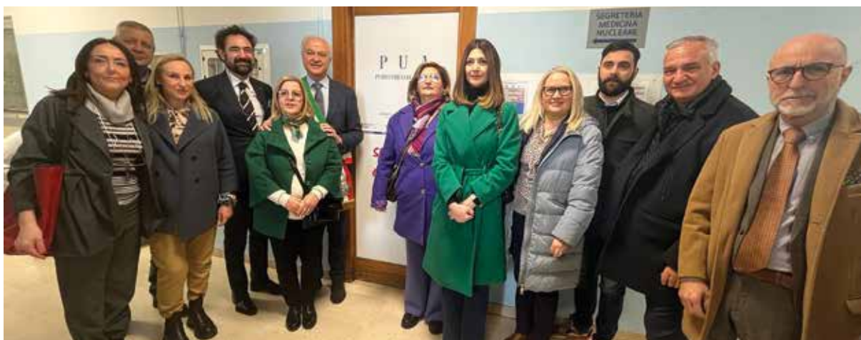
L'Amministrazione comunale con il Commissario Marchitelli

dato seguito all'inaugurazione del secondo sportello di ascolto di prossimità.