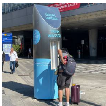
Auch die 45 Döblinger Trinkbrunnen werden durch die dritte ...

Kaum eine Stadt hat so eine hohe Wasserqualität wie Wien. Grund dafür ist die kluge Wasserversorgung. Dies soll auch zukünftig so sein, daher beschloss der Wiener Gemeinderat erst kürzlich weitere 15 Millionen Euro für die Erneuerung bzw. Erweiterung der sogenannten dritten Hauptleitung Nord. Die Arbeiten dazu laufen bereits, zuletzt in Währing. Der nächste Abschnitt kommt im Herbst auf der Krottenbachstraße. Bis 2026 soll damit der Wasserspeicher beim Lainzer Tiergarten in Hietzing mit dem Speicher Hungerberg in Döbling verbunden werden. Damit ist die Verbindung des 19. Bezirks mit der zweiten Wiener Hochquellwasserleitung sichergestellt. Die Quelle unseres Wassers entspringt aus dem