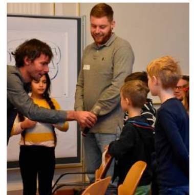
... freuen sich auf ein Parlament der Jugend in Döbling.

über „Anträge“ abzustimmen und einen gemeinsamen politischen Willen zu definieren. Fast wie bei den Großen – oft nur mit besserer Debattenkultur. Gleichzeitig lernen die echten Politiker auch was von den Juniors. Die Wünsche werden der Bezirksvertretung vorgelegt, so soll diese erfahren, was die junge Wählerschaft in Döbling braucht.