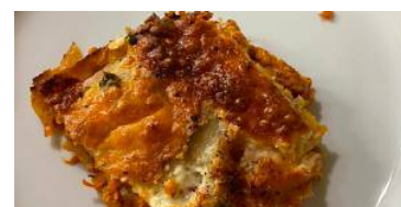
Linsen sind nicht nur gesund, sondern auch sehr bekömmlich.

Zwiebel und Knoblauch mit Olivenöl in einer Pfanne anrösten. Kleingeraspelte Karotten und 125 Gramm rote Linsen hinzufügen, jeweils zur Hälfte mit Gemüsefond und Tomatenpassata ablöschen. Eine halbe Stunde köcheln lassen, würzen. Für die Béchamelsauce 50 Gramm Butter in einem Topf zerlassen. 50 Gramm Mehl langsam hinzufügen, mit dem Schneebesen ständig rühren. Wirft die Masse Blasen, 500 Milliliter Milch schrittweise hinzugeben und rühren, bis die Sauce sämig wird. Mit Muskatnuss und Salz abschmecken. Alles in einer Auflaufform schichten, mit der Soße beginnen. 30 Minuten bei 180 Grad ins Rohr geben. (ast)