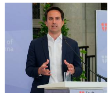
Wiederkehr versichert: Das Kindeswohl habe oberste Priorität.