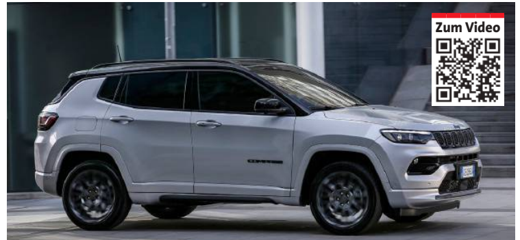
Ab Jahrgang '22 ist der Compass elektrifiziert, von den reinen Verbrennern gibt's noch Lagerfahrzeuge. Das Test-Modell war ein Plug-in-Hybrid.

Schweller und Türverkleidung in Karosseriefarbe, Ledersitze oder auch die elektrische Heck-