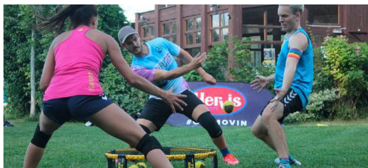
Eine Ballsportart erobert Wien: Roundnet bzw. Spikeball ist ein rasantes Spiel für Teamplayer.

Gewinnen Sie auf meinbezirk.at/bz-gewinnspiel zwei Startplätze für den Wien-Termin am 23. Juli sowie ein Spikeball-Pro-Set im Wert von 100 Euro! (red)