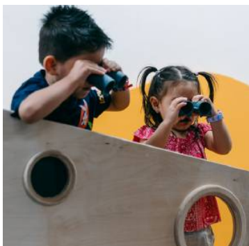
Während sich die Kinder in der Spielecke austoben können ...

Hier wird in einer eigenen Spielecke herumgetobt, während die Erziehungsberechtigten bei Kaf-