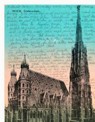
Bereits 2021 wurden Ansichtskarten transkribiert.

Geschichtsliebhaber, aufgepasst: Historische Briefe, Postkarten und andere Schriftstücke sollen von Freiwilligen transkribiert und der Öffentlichkeit zur Verfügung gestellt werden. Möglich macht das die neue Plattform Crowdsourcing.wien, die vom Wien Museum und der Wienbibliothek im Rathaus ins Leben gerufen wurde. Seit 4. Juli können sich Interessierte auf der Plattform registrieren und aktuell 1.134 Briefe aus den Jahren 1914 bis 1919 transkribieren. Die Schriftstücke sind in Kurrentschrift, in Lateinschrift oder maschinengeschrieben. Darunter finden sich auch Gustostückerl von dem Literaten Peter Altenberg, dem Komponisten Alban Berg oder der Frauenrechtlerin Lily Braun. Nach Abschluss des Projektes werden die Transkriptionen auf der Plattform veröffentlicht. Mit Hilfe der Allgemeinheit sollen in den nächsten Jahren