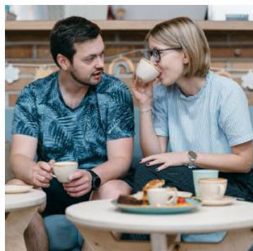
... tauschen sich die Eltern untereinander aus.