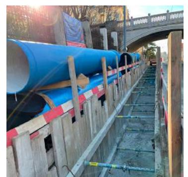
... Hauptwasserleitung Nord bald versorgt. Hier ein Bild vom Februar.

Hochschwabgebiet in der Steiermark und liefert auf einer Strecke von über über 180 Kilometer Wasser nach Wien.