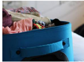
Beim Packen auch an die Gesundheit denken.

doch auch eine einschläfernde Wirkung. Eine pflanzliche Alternative bieten beispielsweise Ingwerpräparate. Die häufigste „Reisekrankheit“ ist Durchfall. Trifft einen Montezumas Rache gilt es, den Flüssigkeits- und Mineralverlust auszugleichen. Ein Elektrolytgetränk lässt sich auch selbst aus je einem halben Liter Mineralwasser und Fruchtsaft, vier Teelöffeln Zucker und einem dreiviertel Teelöffel Salz herstellen. Durchfallhemmende Medikamente sollten nur dann eingenommen, wenn beispielsweise eine längere Fahrt in einem toilettenlosen Bus ansteht. Diese verzögern nämlich das Ausscheiden der verursachenden Erreger. Vor allem in südlichen Gefilden darf ein an den Hauttyp angepasstes Sonnenschutzmittel nicht fehlen. Erholung für die Haut nach dem Sonnenbad bieten kühlende Gels, beispielsweise